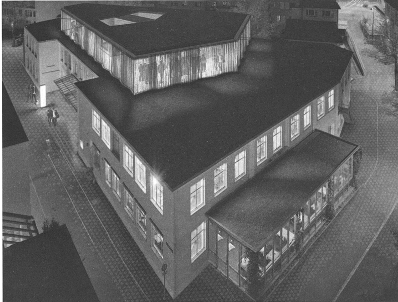
Die neue Alte Fabrik in Rapperswil-Jona.

Was haben WCs mit Kultur zu tun? In Rapperswil-Jona ziemlich viel. Denn dort, wo die Geberit jahrzehntelang Spülkästen fürs stille Örtchen herstellte, wird heute der Kultur gehuldigt: In der Alten Fabrik sind seit März das neue Kulturzentrum und die Stadtbibliothek untergebracht.