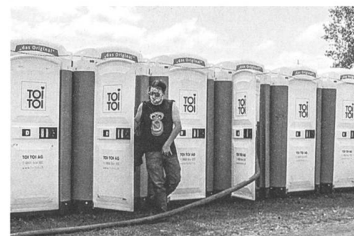
So macht man das ordeli: Hiphopper am Openair Frauenfeld 2011.

Zugegeben, nicht sehr appetitlich. Sollten Sie das hier im Saiten zum Zmorge lesen: Lesen Sie im Zweifelsfall später weiter. Man muss nicht Mitglied beim Bund der Steuerzahler sein, um zu wissen, dass Vorkommnisse, die im öffentlichen Raum als Problem eingestuft oder dargestellt werden, schnell Geld kosten. Entweder werden Kosten über Steuern sozialisiert («Polizeiaufstockung jetzt!») oder abgewälzt (Olma-Bratwurst mit Security-Zuschlag neu 9.80 Franken). Immer aber wird jemand sowas finanziell oder politisch kapitalisieren wollen.