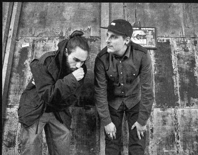
Taiken (links) und Doppia Erre.

Vorlage und Inspirationsquelle für Lyrical Psycho II war der 80er-Jahre-Manga Fist of the North Star , später in mehreren Varianten verfilmt, von den beiden Japanern Buronson (Story) und Tetsuo Hara (Zeichnungen): Hauptfigur Kenshiro – «einer unserer liebsten Jugendhelden» – muss darin unter anderem Kaioh, den Anführer der Mutanten, und zu Beginn seinen Bruder Raoh besiegen, der die von einem Atomkrieg verwüstete Welt erobern will. Beide Brüder beherrschen Hokuto Shinken, eine Kampfkunst, die den Körper des Gegners per Druck auf die Meridianpunkte zerbersten lässt. Anleihen an diesen Meilenstein des japanischen Comics finden sich überall auf Lyrical Psycho II , in Form von gesampelten Audioschnipseln, Spoken Word Pieces aus der Anime-Serie ( Marlene feat. MC Pat ), japanischen Zithern und Flöten ( Da Solo, NoKen, Il tuo destino feat. Dominique Bouvier ).