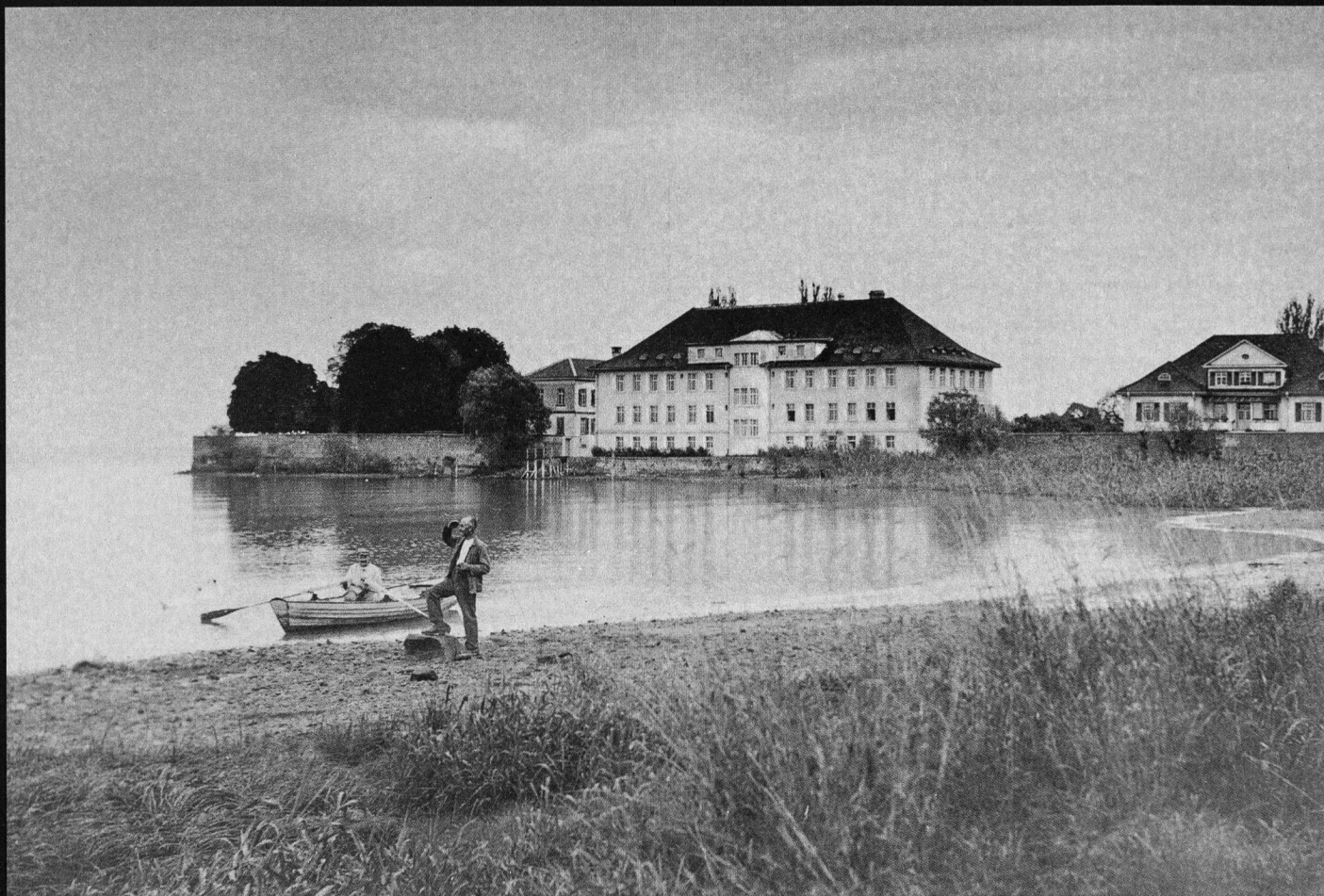
«Seeseite»: Die Anstalt Münsterlingen, Männerabteilungen U und K, undatiert.