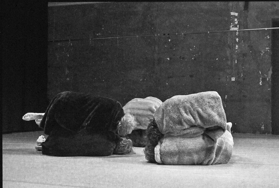
Gut bepelzt: Probenbild zu Wildwechsel.