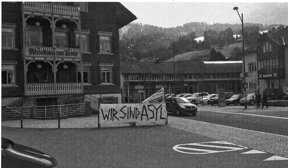
«Wir sind Asyl»-Plakat in Alberschwende: Das passt nicht allen.

Ernst Jandls zum geflügelten Wort gewordene Gedichtzeilen «lechts und rinks kann man nicht verwechsern. werch ein illtum!» kommen einem wieder einmal in den Sinn, wenn man aktuelle Geschehnisse in Vorarlberg betrachtet. Ein Politiker stolpert über eine sieben Jahre alte Dummheit, eine «Pegida» erweist sich als ein Häuflein Neonazis, Besoffene erklären, sie wollten nicht Asylbewerber, sondern Asylgeber verprügeln, ein Pfarrer beruft sich auf Hitler. Doch der Reihe nach: