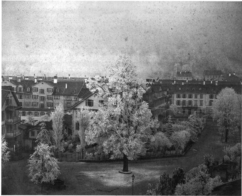
Blick Richtung Union einst: Winterfotografie des noch parkgaragefreien St.Gallen, Otto Pfenninger 1882.

In Absprache mit dem Heimatschutz, dem WWF und dem VCS legen Juristinnen und Juristen hier dar, dass die Garage nicht bewilligt werden