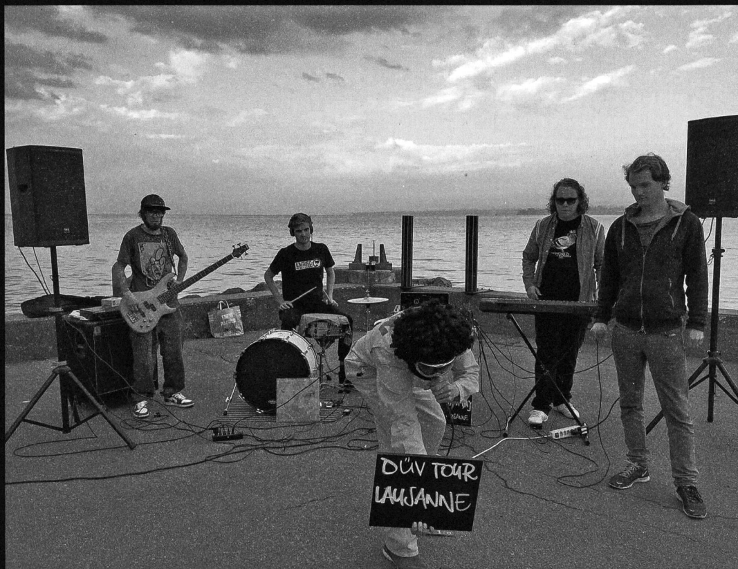
Zum Znüni in Lausanne: die üblichen Verdächtigen.

Ham-E und E.S.I.K. haben eine EP gemacht, Schuldig und verdächtig heisst sie. Gefeierte wurde das mit einer ambitionierten Schweizerreise: zehn Konzerte in zehn Städten. Alles an einem Tag. von Corinne Riedener