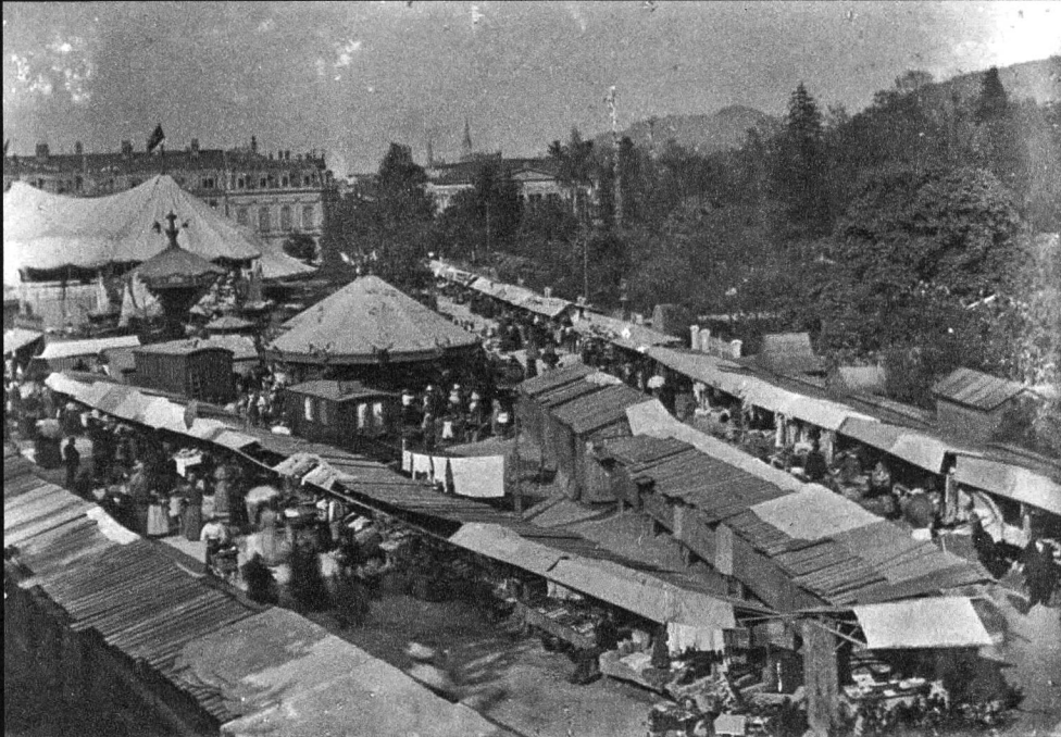
Jahrmarkt auf dem Brühl, um 1900.

«Das Jahrmarktleben auf dem untern Brühl bot auch diesen Herbst viel Sehenswertes. Das Gewoge der Menschenmenge, das Schmettern der Trompeten, der Lärm der Geschäftsanspreiser, das Knattern der Gewehre etc. erfreute wieder besonders die junge Welt. Der grössten Anziehungskraft erfreute sich das Theater Variété. Wer hätte den behelmten und beharnischten, vor Frost zähneklappernden Damen widerstehen können, sie mit ihrem Besuche zu beehren.» So stand es am 23. Oktober 1889 im «St.Galler Stadtanzeiger».