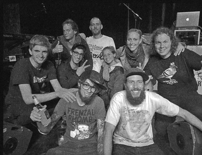
Zufrieden und gebodigt: die D.Ü.V.-Gang bei der Ankunft im Flon.

Ham-E & E.S.I.K.: Schuldig und verdächtig , Vinyl oder Download, seit 11. September im Handel. schuldigungundverdaechtig.ch