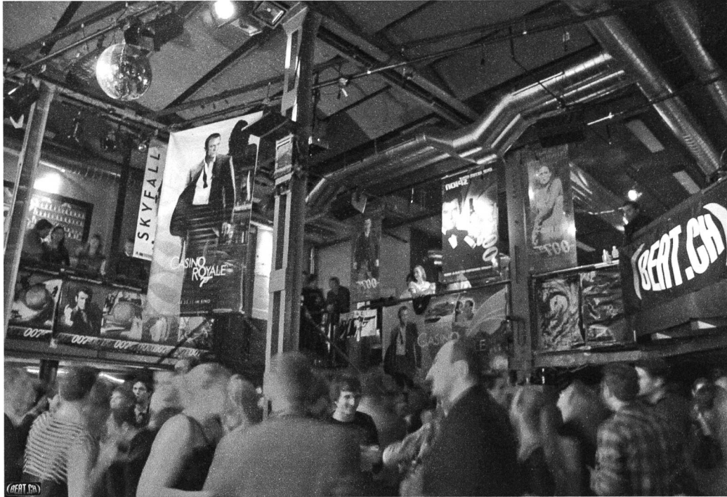
Schaffhausen brummt: James-Bond-Party im Taptab.

In meiner Bandbreite an Emotionen gibt es ein ganz bestimmtes Gefühl, das sich immer nur in einer speziellen Situation einstellt: das Frühstücksbuffet-Dilemma. Es ist mittelpäter Morgen an einem lauschigen Wochenende, du trittst noch restverschlafen in irgendeinen Ess-Raum und dein Blick fällt auf das Buffet. Es ist überwältigend bunt, erfreulich gross, hat Warmes und Kaltes, Gesundes und Fettiges, Leichtes und Währschaftes. Und während du von den Trauben zum Zopf zum Müsli zum Orangensaft blinzelst (oder von mir aus zu Schinken und Rührei), ergreift dich das Gefühl: Wow, ich kann niemals so viel essen, wie ich jetzt wollen würde. Das Frühstücksbuffet-Dilemma. Ich empfand es letztens fernab von jeglichem Frühstück. Genau genommen war es später Samstag-nachmittag: Ich schritt durch die Schaffhauser Neustadtgasse, die an diesem Septembertag ein Strassenfest feierte. Auf der sonst eher stillen Gasse standen Bartische und Liegestühle, irgendwer spielte sowas wie Handball, eine Band machte Musik. An diesem Wochenende ereignete sich alle paar Schritte ein Fest: Mal abgesperrt in einer Garage, mal auf offener, offiziell autogesperrter Strasse mit afrikanischem Essen, mal in WGs und Ateliers. Das Wetter war kühl, leicht feucht, wenig sommerlich. Und den Menschen wars egal; sie erschienen alle, alt und mittelalt und jung und winzig, Elektrofrendinnen und Kulturkuchen und Politikaktivistinnen und Exilschaffhauser.