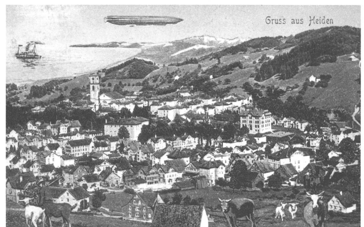
Mit dem Zeppelin über das Expo-Land – im Jahre 1911.