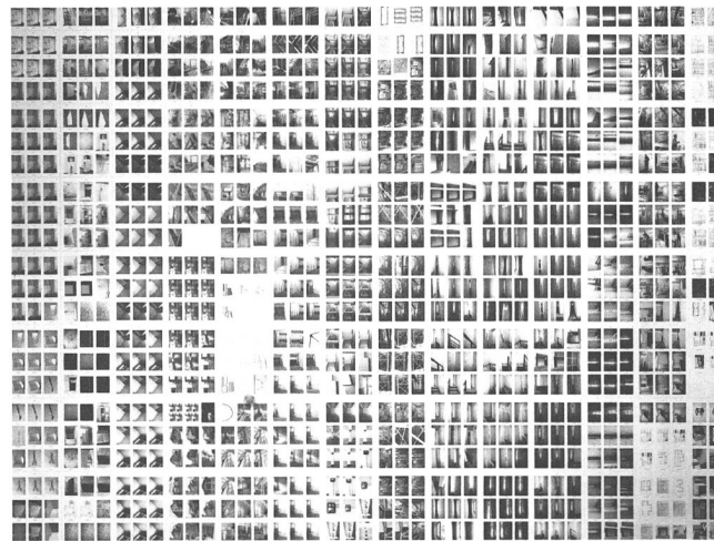
Annina Frehner: Index No 1 .

22 Der Raum ist einfach da. Ein Besuch in Gilgi Guggenheims Museum der Leere.