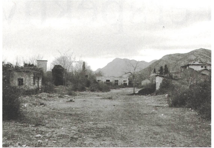
Durch die Siedlung Hum verlief während des Bosnienkrieges die Frontlinie. Wo sich früher um eine Werkzeugfabrik die Steinhäuser der Angestellten sammelten, sind heute nur noch wenige Häuser bewohnt. Ruinen dominieren das Bild.