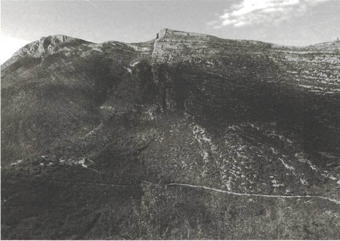
Das Dorf Orahov Do nahe an der Grenze zu Kroatien.