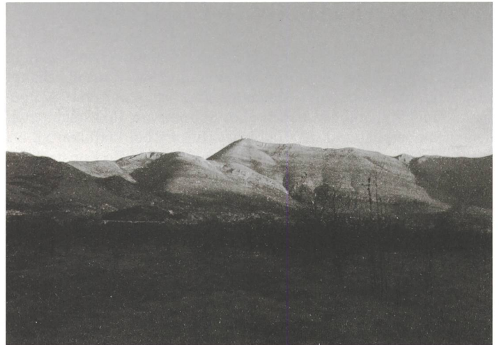
Blick auf den Leotar, den Hausberg von Trebinje, in der Morgensonne. Der Leotar (Bildmitte mit Antenne) ist gut 1200 Meter hoch – von Trebinje aus, das auf rund 280 Metern über Meer liegt, eine schöne und teils brutal steile Wanderung.