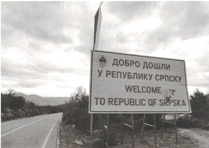
Bosnien und Herzegowina ist seit dem Friedensabkommen von Dayton Ende 1995 in zwei sogenannte Entitäten (Teilstaaten) aufgeteilt. Solche Tafeln markieren den Übergang von der Föderation Bosnien und Herzegowina zur Republika Srpska.