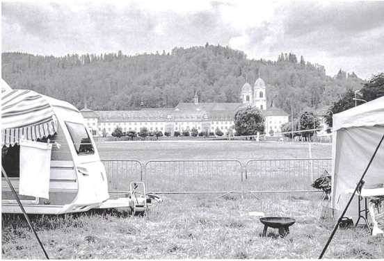
Romane Thana.