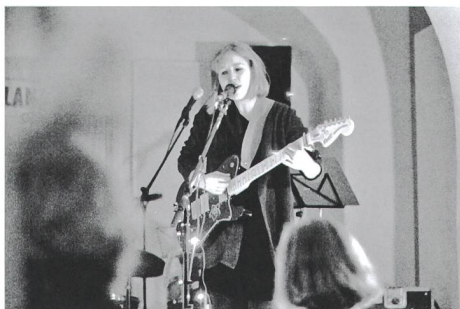
LouEes am letztjährigen Disorder.

Die Bands werden sich während des Festivals an ein Timetable halten, aller-