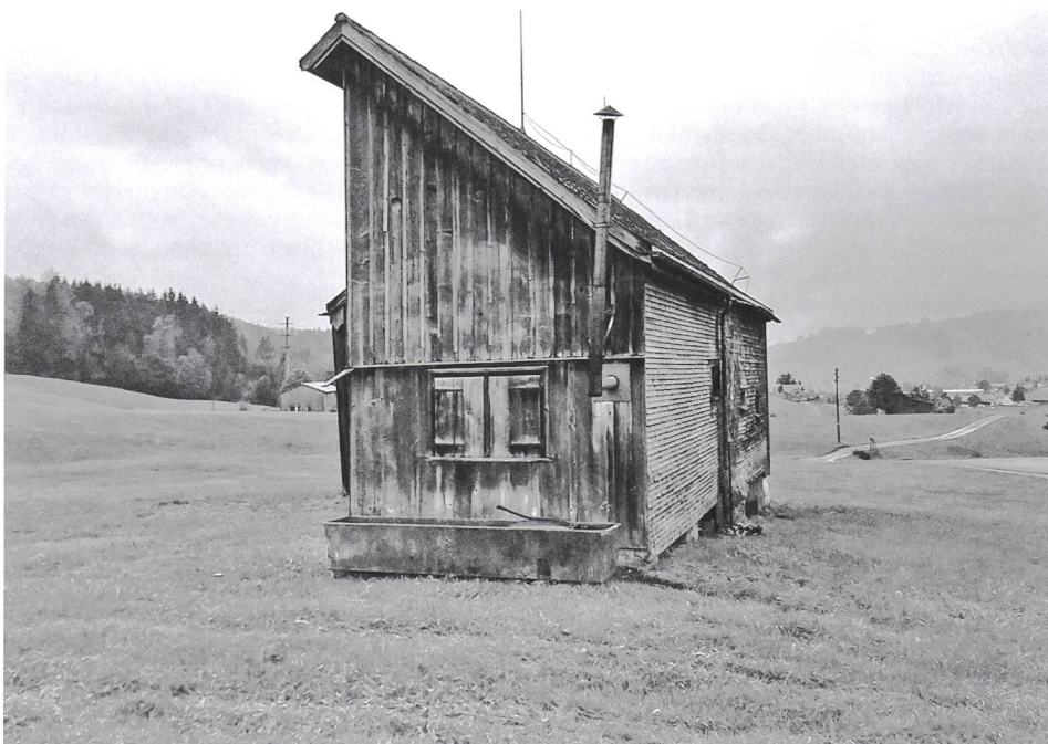
Einer der zehn Schopfe.

Dieser Beitrag erschien zuerst auf saiten.ch .