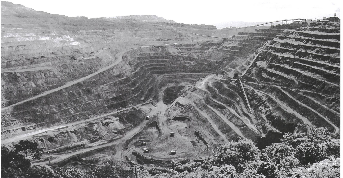
Die Antapaccay-Mine in Espinar, Peru.

gen bei unseren Tieren, aber Glencore kümmert das überhaupt nicht.» Der nahegelegene Rio Salado sei stark verseucht, bestätigt ein einheimischer Aktivist. «Dieser Fluss müsste dringend saniert werden.»