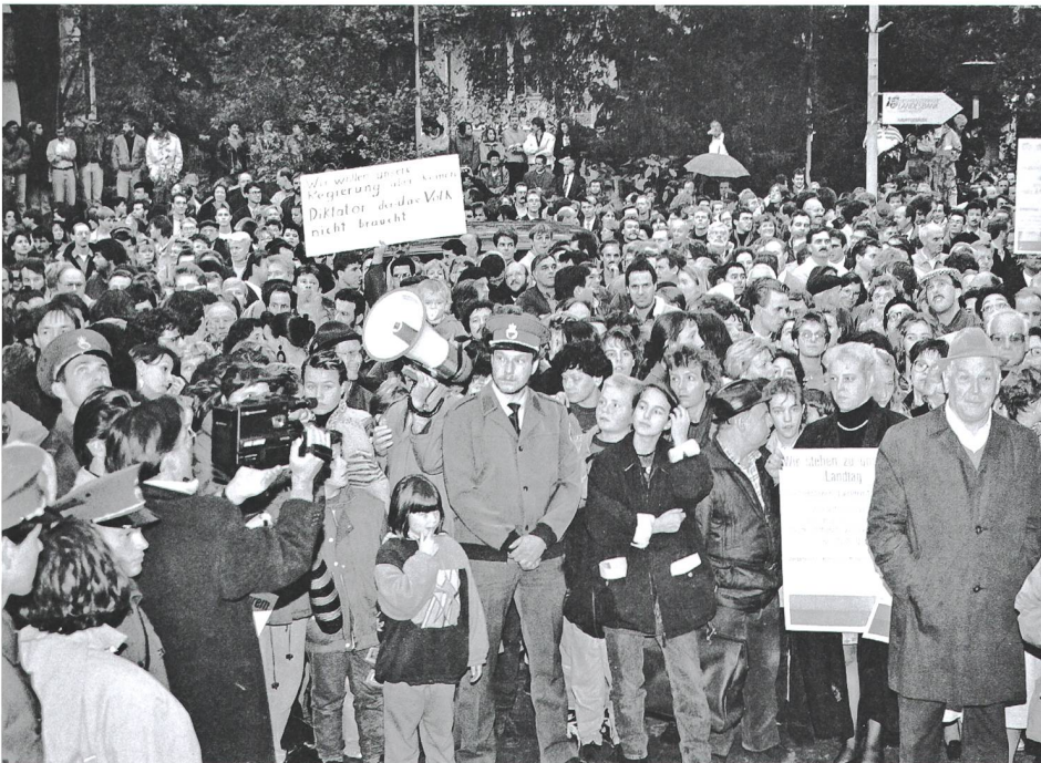
Demonstration für den Landtag, 28. Oktober 1992, Vaduz vor dem Regierungsgebäude.

Als ich diesen Rezensionsauftrag annahm, dachte ich mir, sehr schön, jetzt wird mir endlich klar werden, was mich vor 25 Jahren an den Liechtensteiner Verhältnissen irritiert hatte. Ich fuhr damals zu Ausstellungen, Theateraufführungen und Restaurantbesuchen in das eine Autostunde entfernte Fürstentum und las im Oktober 1992 in Zeitungen die Berichte über Querelen zwischen Fürst, Regierung und Landtag, bei welchen Hans-Adam II. mit seiner Übersiedlung nach Wien drohte, wonach sich – wie er spottete – Liechtenstein dann «Republik Oberrhein» nennen könne.