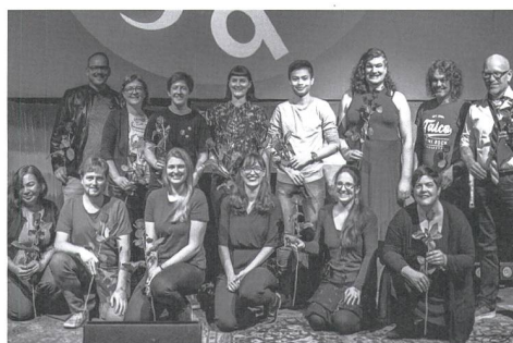
Die queerfeministische Liste «q*f».

Nun ist die Erweiterung der Antirassismus-Strafnorm aber nicht die einzige Angelegenheit, bei der queere Perspektiven relevant sind. Ende August befand die Rechtskommission des Nationalrats, dass die Ehe für alle zwar Zukunft habe, aber ohne den Zugang zu Samenspenden, der vor allem für Frauenpaare die nötige Basis einer Familiengründung wäre. Hätte