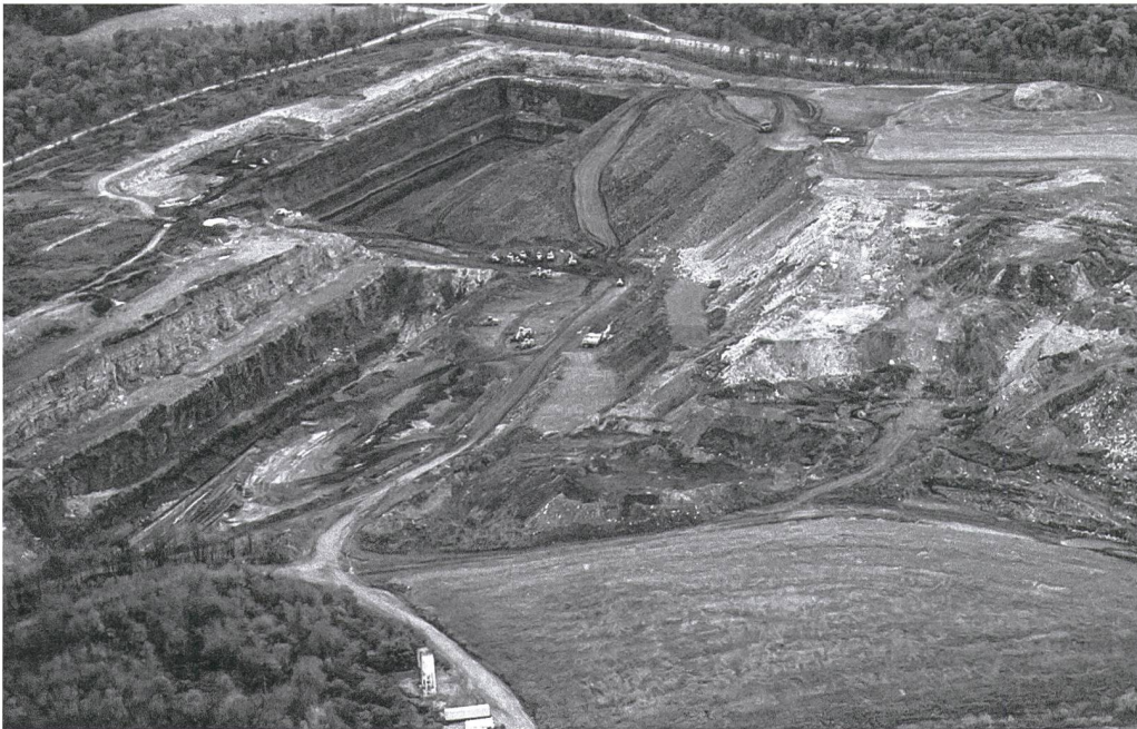
Die Kohlemine gegenüber dem Haus aus der Kindheit.

kämpften wir jedes Mal mit unendlichen Kohlenstaubschichten. Mit unseren Fingern zeichneten wir oft Dinge auf die dreckigen Fensterscheiben, bevor wir sie sauber wischten.