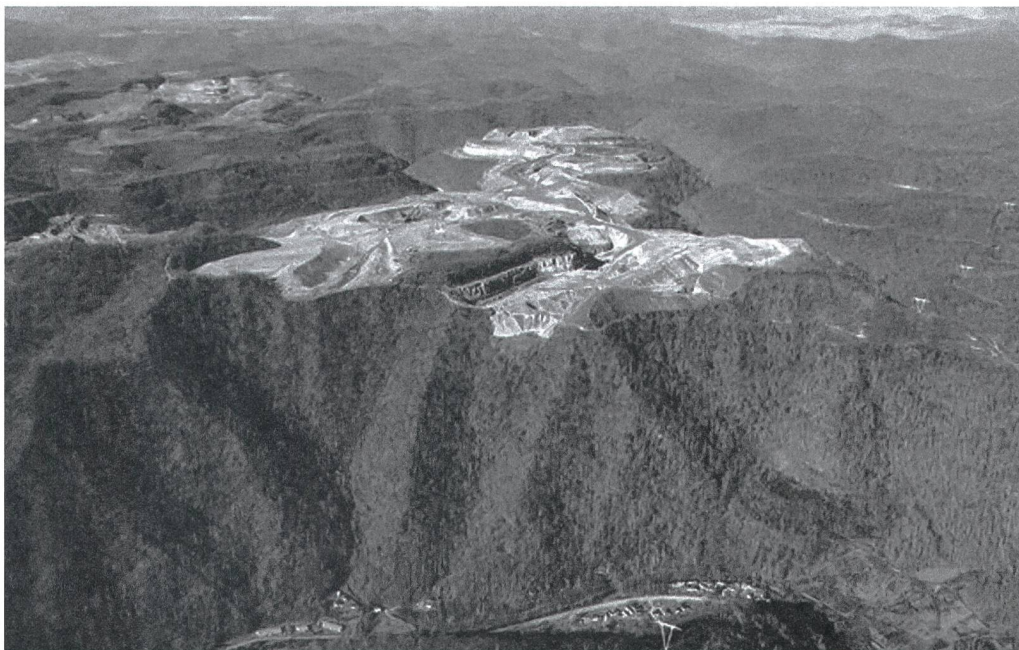
Mountaintop Mining: Wenn die Berge durch den Kohleabbau ihre Gipfel verlieren.

Wenn Sie jemals in Washington, D.C. sind, sollten Sie eine Fahrt in den Westen zu den Appalachen unternehmen, (nachdem Sie das Smithsonian-Institut besucht und den Nationalpark entlang gegangen sind). Steigen Sie in ein Auto, in wenigen Stunden befinden Sie sich in West-Maryland. Dort befindet sich auch der Bezirk Alleghany, der Ort meiner Kindheit.