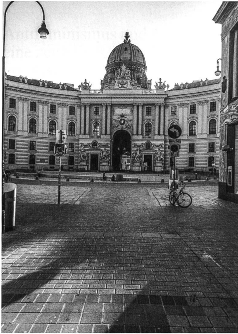
Wien, leergefegt