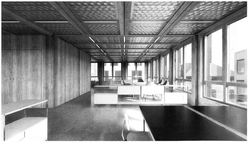
Visualisierung des Neubaus und der Büros im Dachgeschoss.

Planung ging man von rund 70 Arbeitsplätzen aus. Dafür würde man das ganze Haus – mit Ausnahme des Erdgeschosses – selber brauchen. Im Erdgeschoss sind Ladenflächen geplant. Ob dann nicht doch noch Drittmietler Platz haben, werde man erst später sehen.