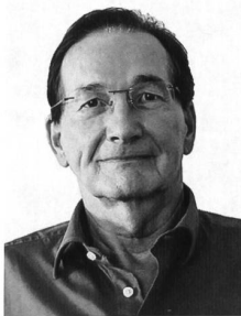
Dieser Beitrag erschien auch auf saiten.ch

Die Konzerne werden die gesetzlich verbindlichen Sorgfaltspflichten beachten, wenn sie einmal erlassen sind. Natürlich entstehen daraus Kosten, zum Beispiel für den Umweltschutz beim Betreiben einer Mine oder beim Entsorgen giftiger Fabrikabfälle. Oder für den Feuerschutz beim Betreiben einer Fabrik. Oder auch, wenn keine Kinder beschäftigt werden können. Kosten wollen die Konzernmanager grundsätzlich vermeiden. Gibt es aber gesetzliche Sorgfaltspflichten, nehmen sie in der Regel die Kosten in die Kalkulation auf. Es liegt daher in der Hand und in der Verantwortung der schweizerischen Stimmbürgerinnen und Stimmbürger, ob die hier ansässigen Konzerne bei ihren globalen Geschäften Sorgfaltspflichten für Mensch und Umwelt einhalten oder nicht.