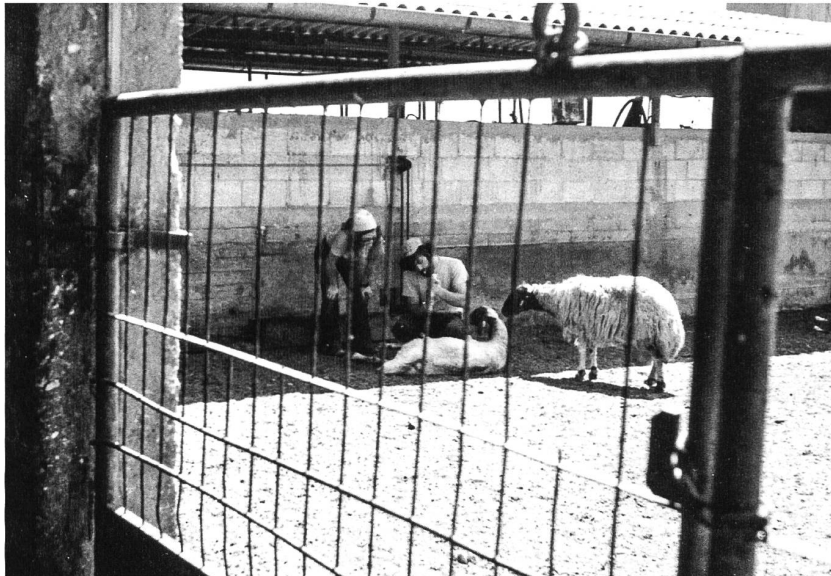
Volontärin Margot Blaser und ein Kibbutznik pflegen kranke Schafe.

riger zu führen, schliesslich war sie Polar getauft worden, nach dem richtungsweisenden Stern. Sie unterstützt bis heute die Pfadfinderbewegung, für sie eine Herzensangelegenheit.