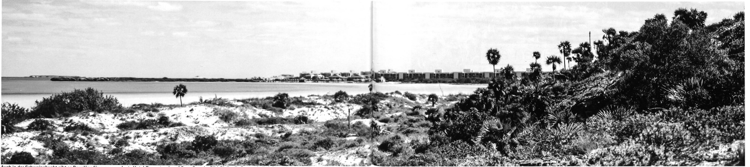
Auch in der Schweinebucht gibt es Baupläne für grossangelegte Hotel-Resorts wie auf Cayo Coco im Bild. Bleibt die Frage, ob die Infrastruktur hält, bis genügend Touristen die Zimmer belegen.

Dem französischen Korsar Gilberto Girón erging es gar nicht gut, als er 1604 am westlichen Ende der Bahía de Cochinos an jenem Strand landete, dem er später seinen Namen geben sollte. Nicht etwa, weil er sich die Fusssohlen geschunden hätte am spitzigen, schwarzen Lavagestein, der dieses Gestade prägt. Es gibt auch einige Stellen mit feinem, weissen Sand. Der Pirat hatte es auf Ärger abgesehen, den Bischof von Kuba entführt und Lösegeld gefordert. Wutenbrannte Bewohner des Städtchens Bayamo nahmen die Verfolgung entlang der Küste auf. In der Schweinebucht stellten sie den Franzosen. Ein afrikanischer Sklave schnitt Gilberto Girón den Kopf ab. So will es die Legende. Auch eine andere fremde Macht kassierte hier eine welthistorische Niederlage.