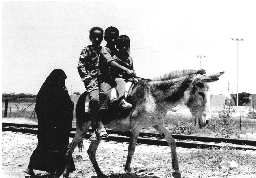
Im Gaza-Streifen, Frühsommer 1973.

im Kibbuz Kfar Aza ein Taschengeld und einen Gutschein für den Kibbuzladen, der winzig ist, aber mit allem Wichtigem bestückt.