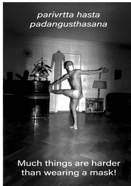
P. S. Bild zum Text

«Kein Durchkommen»: Das galt Anfang Dezember für die städtische Velo-Community. Kaum hatte es einmal ordentlich geschneit, kapitulierten die Stadtwerke vor der weissen Pracht. Beziehungsweise schaufelten sie den Velos in die Spur. Saiten protestierte, und die Velofreunde diskutierten, ob nun eigentlich der Winter für Velos oder Velos für den Winter gemacht seien. Dass der Winterdienst aus Spargründen reduziert wurde, machte die pflotschige Sache nicht unbedingt besser. Der ganze Beitrag hier: saiten.ch/kein-durchkommen .