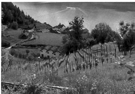
Der Blick vom Quintner Rebbergs hinunter zum Walensee

die Ferienhausbesitzer:innen sind in der Überzahl. Einst war Quinten ein richtiges Dorf mit allem Drum und Dran, samt kleinem Laden und regem Schiffshandel. In den 70er-Jahren wurde die Schule geschlossen, die Post war 2004 dran, zum Einkaufen muss man heute nach Murg, Unterterzen oder Walenstadt. Wobei es sich da vor allem um nicht alltägliche Güter handelt, denn die Quintner:innen sind nach wie vor geübt darin, sich selber zu versorgen. Nebst Wein, Feigen und Fisch gibt es auch eigenen Senf in Quinten.