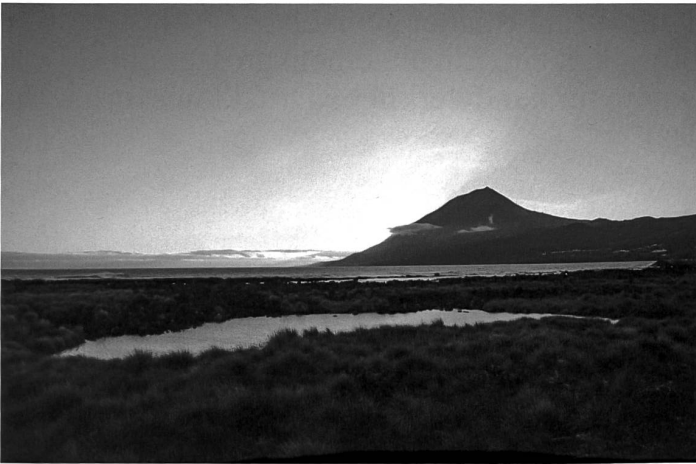
Aussicht vom Fischerdorf Lajes auf den Vulkan von Pico.