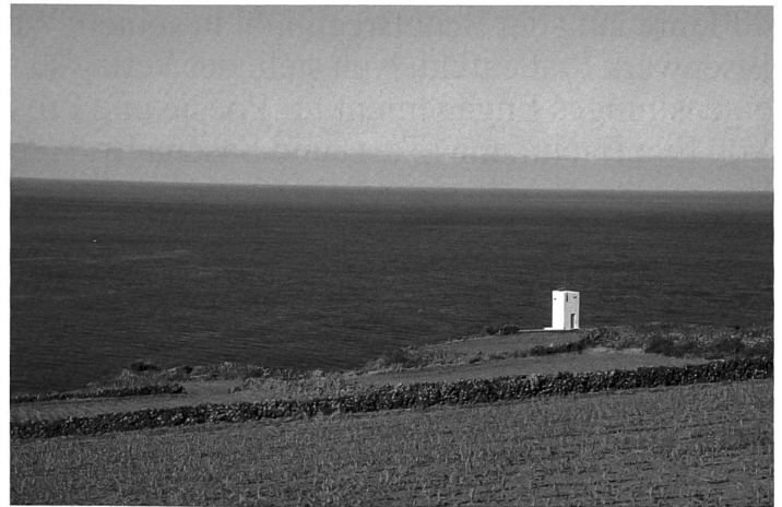
A Vigia: Aussichtsturm auf der Insel Pico, um Walfische aufzuspüren.

Kapitäne segelten von diesen verlorenen Inseln auf die ganze Welt hinaus. Manche kamen zurück, andere blieben in einer weit entfernten Nachbarstadt. Und auch heute noch, wie vor 300 Jahren schon, machen Segelschiffe hier einen Zwischenstopp, um sich mit Nahrung und frischem Wasser zu versorgen.