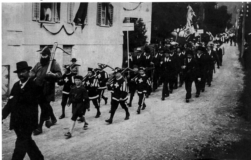
Patriotischer Umzug, frühes 20. Jahrhundert. Unbekannter Ort.