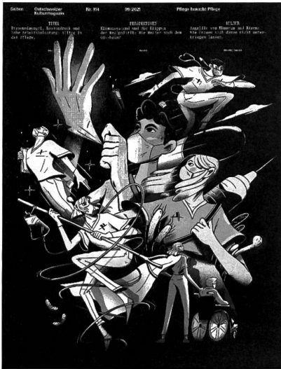
Nr. 314, September 2021

Hallo! Han grad s'Magazin glese und wöt mich bedanke für die tolle Biträg zude Pflegeinitiative! Durch so Biträg hani grossi Hoffnig, dass s'Volk im November richtig abstimme wird. Danke, danke, danke! Es isch dä schönst Bruef, au wens amix härt isch!