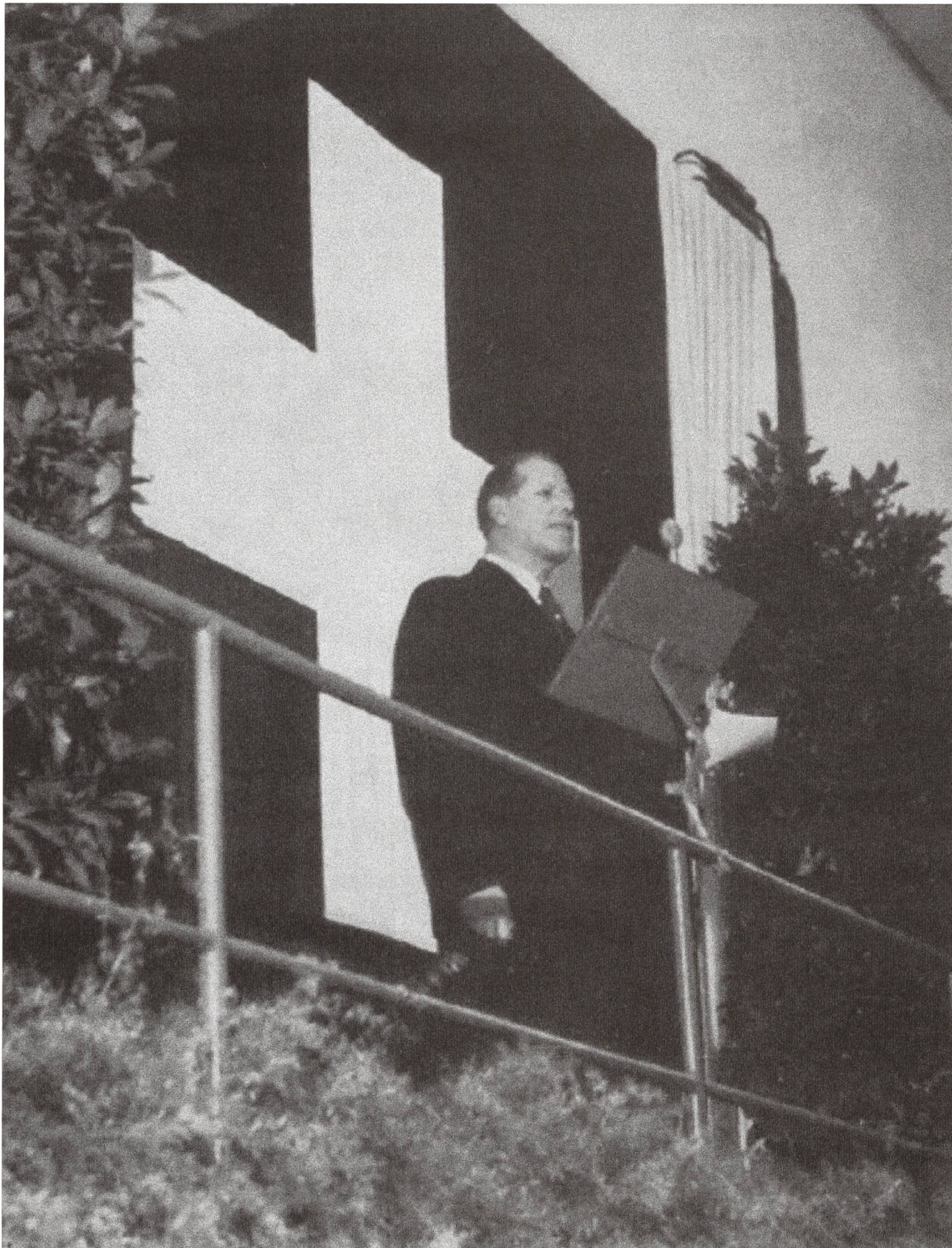
1943 – 19 Jahre nach seiner Ankunft in Oerlikon – hält Emil Bührle erstmals eine Rede vor der gesamten Belegschaft seiner Werkzeugmaschinenfabrik Oerlikon.