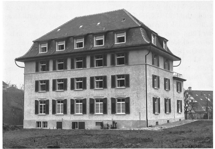
Das Marienheim in Dietfurt SG: Anfangs der 1950er-Jahre lebten hier um die 90 Mädchen und junge Frauen unter der Aufsicht der Ingenbohler Schwestern.

Nach der Streichung sämtlicher Schweizer Firmen von der Schwarzen Liste der Alliierten und ersten, ungewissen Nachkriegsjahren konzentrierte sich Bührle während des Koreakriegs auf die Belieferung des Westblocks mit Rüstungsgütern. An die USA wurden Pulverraketen im Wert von über 150 Millionen Franken verkauft. 1954 erhielt die WO Aufträge von der Schweizer Armee über 100 Millionen Franken, weitere Aufträge kamen aus den Nato-Staaten sowie von einigen frisch dekolonisierten Ländern. Auf Einkünfte aus zivilen Industriezweigen war Bührle senior nie angewiesen. Die Quelle seines Reichtums blieb zeitlebens das Geschäft mit dem Krieg.