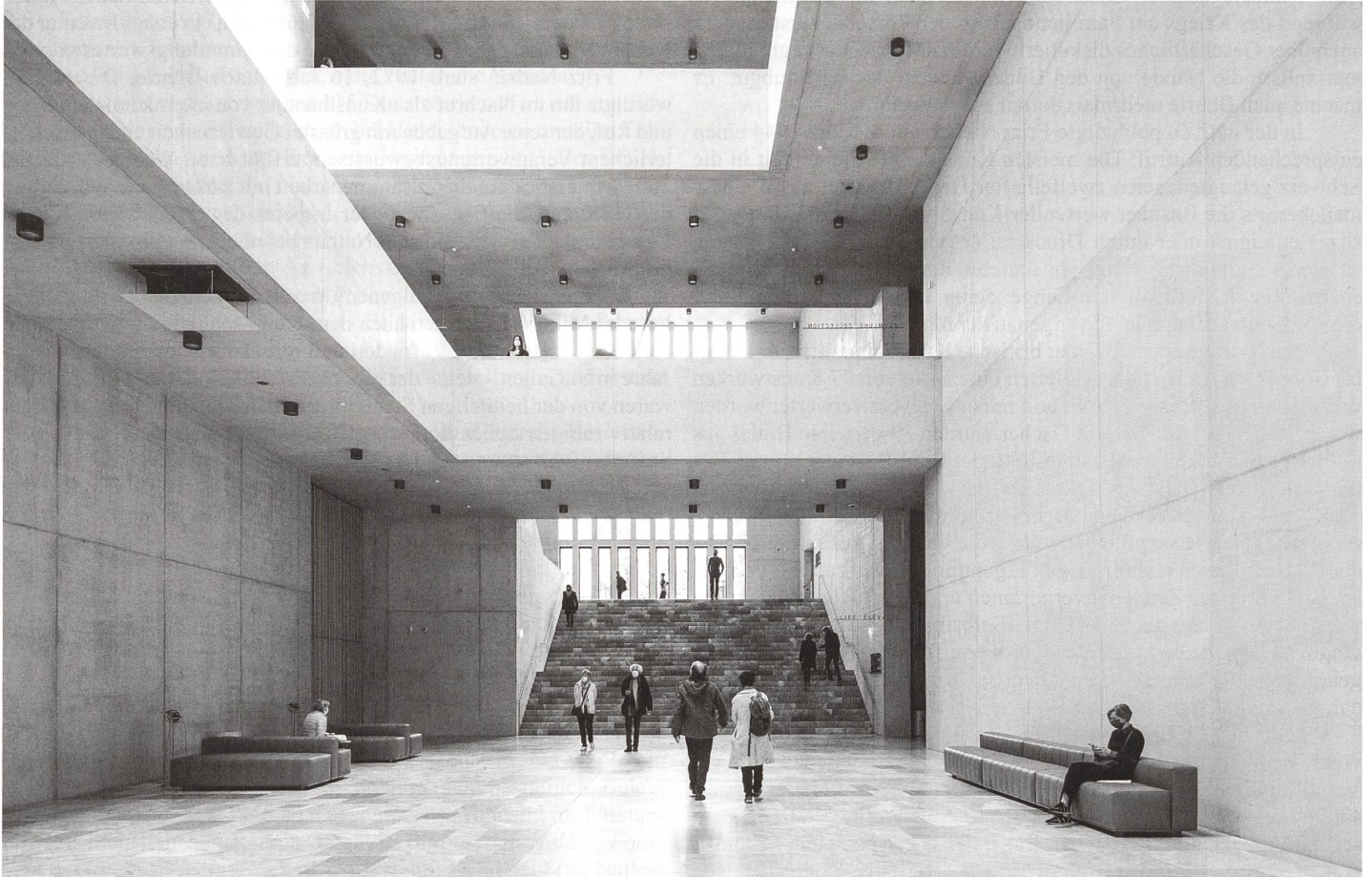
Kunsthhaus Zürich, Chipperfield-Bau, zentrale Halle mit Treppenaufgang

Zürich wollte für sein Kunsthaus die besten Schlagzeilen der Welt und kriegte die schlechtesten. Wie konnte das passieren? Ein Rückblick beim Besuch im Bühler-Neubau. Von Kaspar Surber