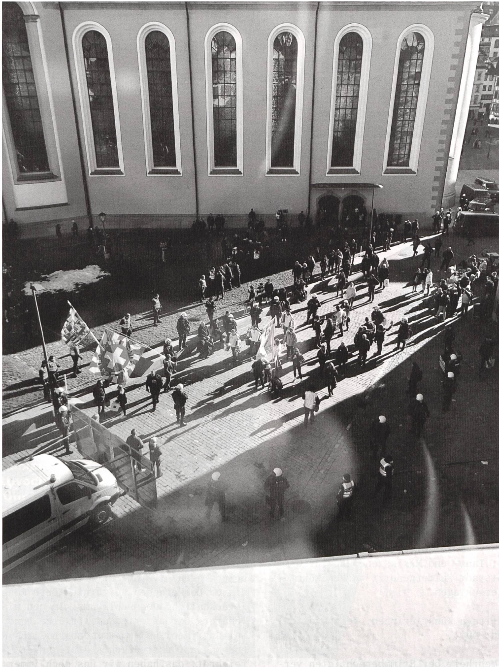
Samstag, 5. Februar, Klosterplatz St.Gallen.

Ein paar rechtsverdrehte Strassenmusikant:innen - ihr bevorzugtes Instrument ist die Treichel, ihr Lieblingssong der Schweizerpsalm - mussten kürzlich die bittere Erfahrung machen, dass die St.Galler Stapo wenig Musikgehör hat, wenn man keine Bewilligung vorweisen kann. So wurden sie, samt Gstältli und Quöllli, kurzerhand und mittels behördlichem Wellenbrecher vom Klosterplatz in die Gallusstrasse spediert, wo sie, eingekesselt und sekundiert von allerhand Groupies, noch eine Weile weiter täubeleten. Die bunte Band der Linken & Netten hingegen, die am selben Tag die Gallengassen mit ihren Gesängen erfüllte, liess man in Ruhe gewähren - was doch einigermaßen ausserordentlich war, kennen sie doch das fehlende Musikgehör der Stapo am besten. Fuf Stutz in Huet! Gegen diese Art der polizeilichen Standortförderung haben wir wenig einzuwenden. (co)