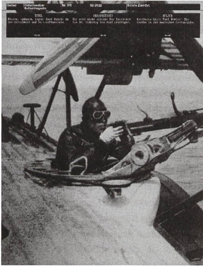
Nr. 319, Februar 2022

Ich bin sehr beeindruckt von der «Bührle»-Ausgabe von Saiten, besonders von der sachlichen informativen Reportage auf den Seiten 16-22. Wenn Sie weiter über Bührle schreiben, würde ich ihr Magazin dafür abonnieren. Kritisieren möchte ich nur die (auch) hier angewandte journalistische Unart, einen Beitrag mit einer Überschrift zu versehen, die nicht vom Autor, sondern von der Leitung der Zeitschrift aus markttechnischen Gründen erfunden ist, auch wenn man ein Zitat aus dem Text verwendet. Ich meine die Zeile (und Aussage): «Das Rüstungsbusiness funktioniert wie der Kunsthandel.» Dieser Behauptung muss ich in aller Form widersprechen.