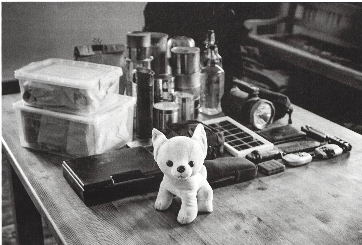
Was in den Notfallrucksack gehört.

tens im Scherz. Aber ich weiss, dass die meisten meiner Freunde ihn schon gepackt haben, und jeder und jede hat einen Plan für den Ernstfall.