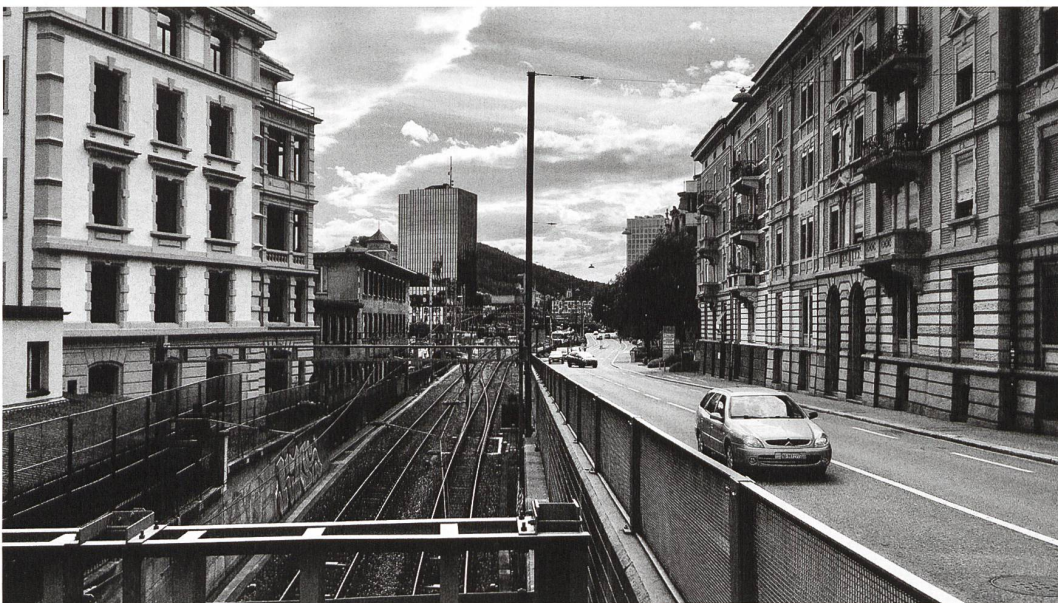
Rosenbergstrasse heute (unten) und morgen – oder übermorgen. (Visualisierung: GSI Architekten)