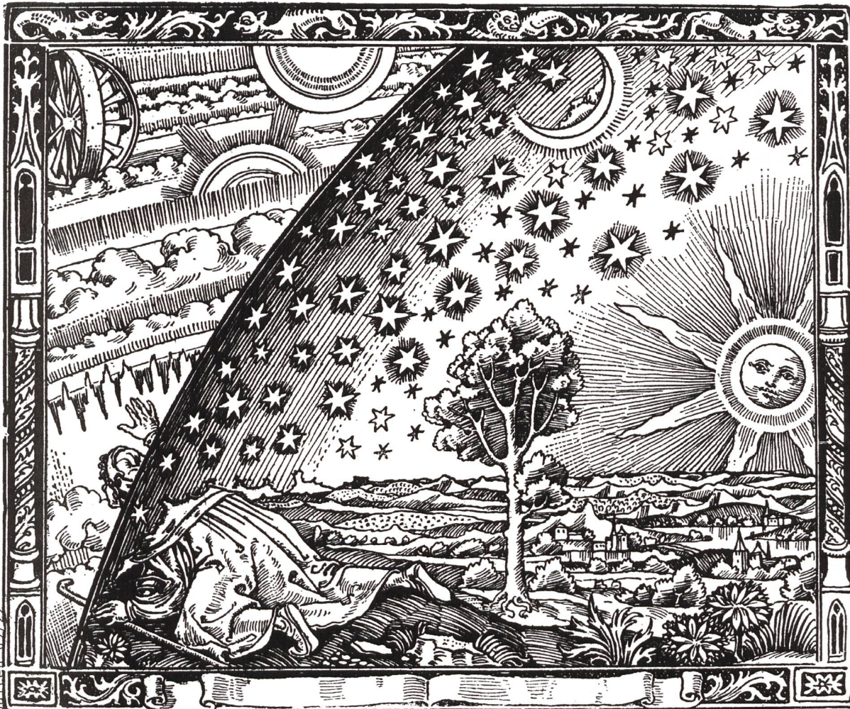
Über den Rand der bekannten Welt hinausschauen: Wanderer am Weltenrand (Flammarions Holzstich, in: L'atmosphère , Paris 1888)

Noch in zwei weiteren Museen in der Stadt St.Gallen wurde neulich eine Chance verspielt, den Blick über die Landesgrenzen und über Europa hinaus zu erweitern. Trotz grosser Bemühungen des Teams der Universität Konstanz um Kirsten Mahlke ist es nicht gelungen, die Ausstellung «Stoff. Blut. Gold. Auf den Spuren der Konstanzer Kolonialzeit» (2021) nach St.Gallen ins Historische und Völkerkundemuseum zu bringen. Und auch eine St.Galler Adaptation der in Stans («Söldner, Reissäckler, Pensionenherren», 2021) und Chur («Beruf: Söldner – Bündner in Fremden Diensten», 2022) erfolgreichen Ausstellungen kam am HVKM offenbar nicht in