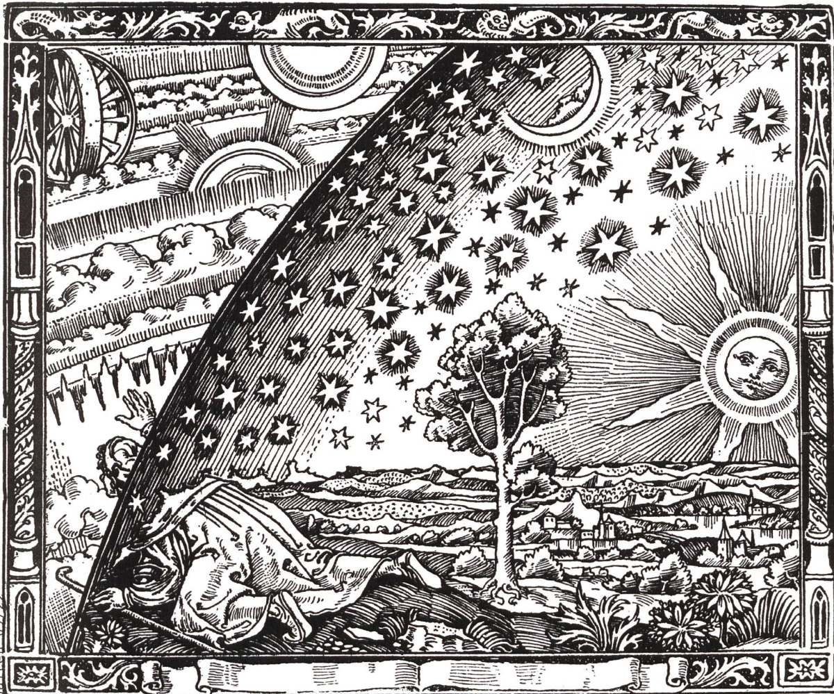
Über den Rand der bekannten Welt hinausschauen: Wanderer am Weltenrand (Flammarions Holzstich, in: L'atmosphère , Paris 1888)