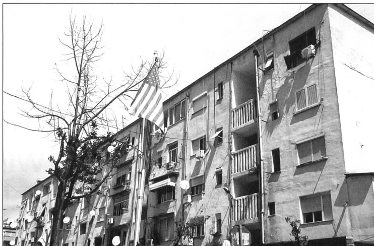
Dem amerikanischen Traum wird nicht mehr ganz so unrealistisch begegnet, aber die USA stehen immer noch für geopolitischen Schutz und persönliche Hoffnung.

Heute hat Tirana ein mediterranes Flair, es fühlt sich für Neuankömmlinge an wie eine Mischung aus Neapel, Istanbul und Athen, auch wenn es rund 30 Autominuten vom Meer entfernt liegt. In Bars hört man griechische Musik. In Supermärkten gibt es italienische Waren; mit der einstigen Besatzungsmacht pflegt man heute Wirtschaftsbeziehungen. Den USA gegenüber ist man dankbar, für die Hoffnung damals und die schützende Hand heute, weswegen man Bäckereien findet namens George W. Bush und Plätze, die nach Woodrow Wilson benannt sind. Die Strasse, in der die russische Botschaft steht, wurde kurzerhand nach Kriegsausbruch in