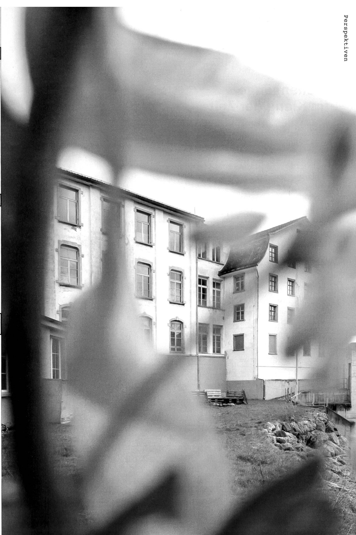
Blick ins Stadtufer