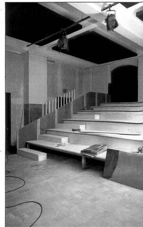
Die Bühne Stadtufer

Aus dem riesigen Raum haben Haller und rund 20 ehrenamtliche Helfer:innen zwei gemacht. Durch einen Eingang geht es zum eigentlichen Theater. Schlagartig verändert sich die Atmosphäre. Über 30 selbstgebaute Akustikelemente aus Steinwolle und Theatermolton schlucken jeglichen Hall und alle Nebengeräusche. An der Decke über der 14 Meter breiten Bühne hängen