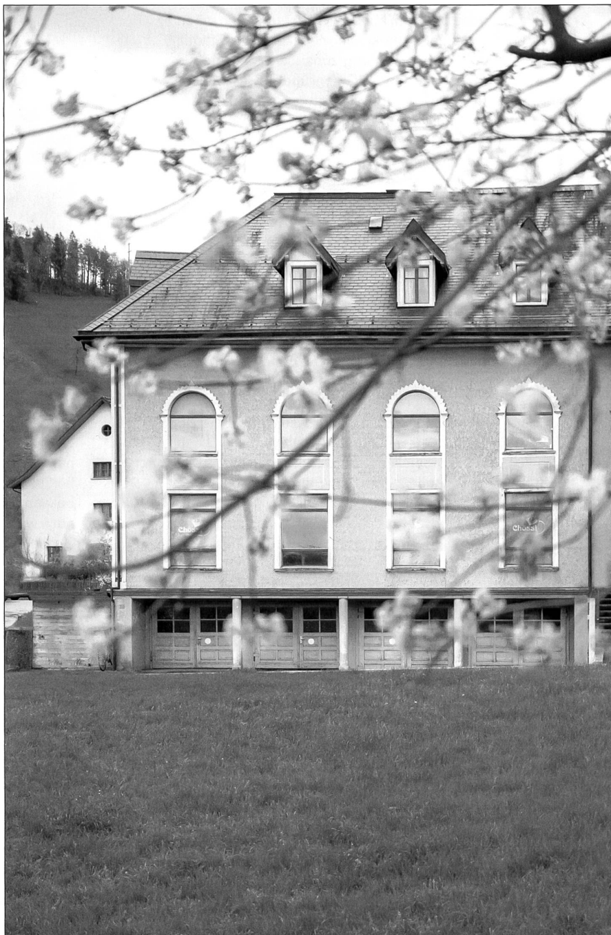
Die Bahnhalle mit dem Chössli Theater

Bevor er sich aber um das sommerliche Alltagsleben kümmern kann, steht zuerst einmal der «Super Saturday» am 29. April auf dem Programm. So jedenfalls wird dieser Tag inoffiziell genannt. Dann kommt in Lichtensteig alles zusammen: Die ersten Pionier:innen reisen an, im Rathaus für Kultur findet die LEWE-Tagung zum Thema Stadtentwicklung statt, der Ort für Macher*innen lädt zur Vernissage der Ausstellung «Lichtensteig reloaded», der Frühlingsmarkt der Chäas Welt findet