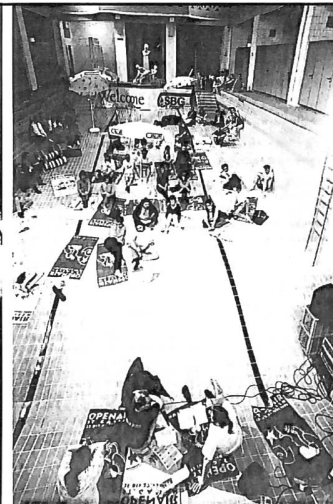
«Erlebnis-Journalismus»: Das neue Openair-OK lädt zur Pressekonferenz mit Beach-Feeling ins trockengelegte Volksbad-Becken.

Quellen: Ausgaben vom April 1994 der «Ostschweizer AZ» (eingestellt 1996) und von «Die Ostschweiz» (eingestellt 1997) und ein bisschen Internet (Einstellung ausstehend).