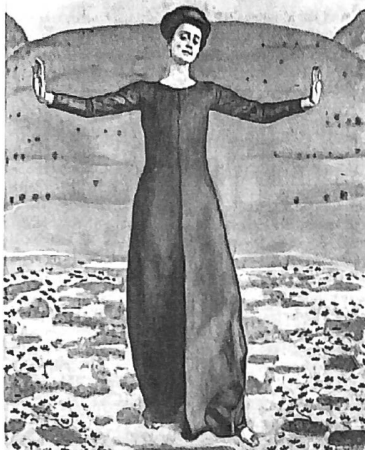
Hodlers Lied aus der Ferne (1906)