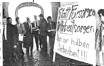
Die St. Galler Regierung lehnt die linke «Krisen-Initiative» ohne Gegenvorschlag ab.