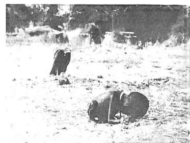
Pulitzer-Preisbild von Kevin Carter, aufgenommen 1993 im Sudan.