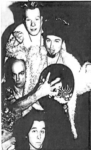
Freaky Fukin Weir doz

Der Verein «Pop me Gallus» bietet mit der Konzertreihe «Rock-Donstchtig» im «Seeger» Ostschweizer Bands eine Plattform. Der Einladung folgen im April 1994 Birds of Paradise, Moutards Blö und Fagiolo. Ausserdem bringt «Pop me Gallus» das erste Saiten-Magazin heraus.