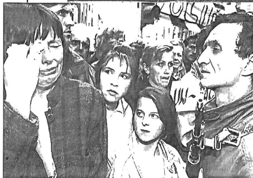
Die Bevölkerung von Gorazde wird weiterhin bombardiert. Die NATO fliegt im Gegenzug erste Angriffe gegen serbische Stellungen.