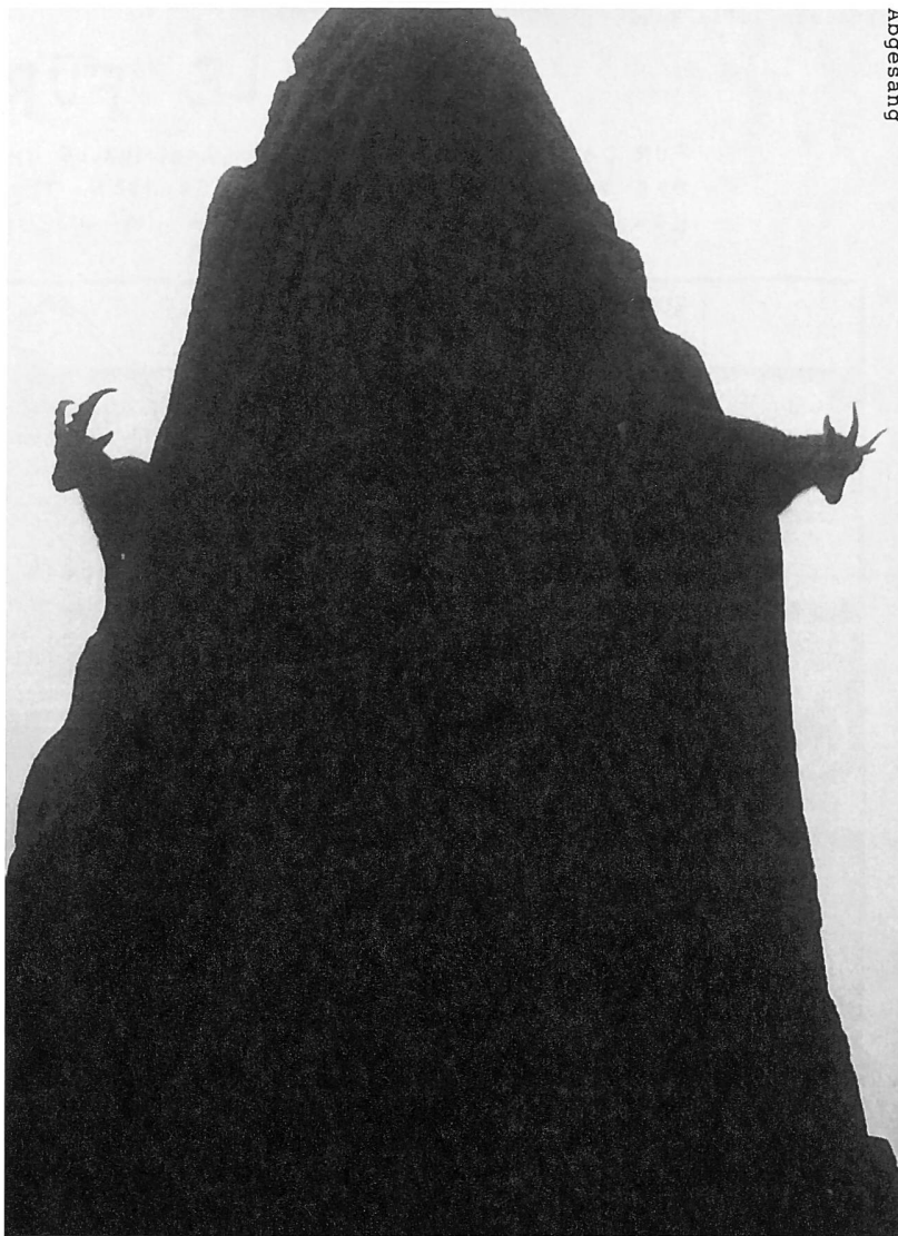
Peter und Paul im Nebel.

Ärzte sagen, das rechte Auge habe sich damals für immer abgeschaltet. Man hätte es daran hindern können. Doch an der OPOS verfolgten sie eine neue Methode, die sich erst später als falsch erwies. Und nun zu Vetter Johann, der mich auf Betreiben der Grossmutter eben doch besuchte: Er nahm mich mit in den Tierpark Peter und Paul.