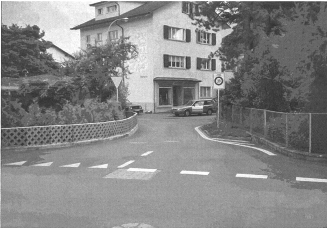
Abbildung 2: Tor «siedlungsorientierte Strasse» © bfu.

Infrastrukturbereich ist ein wichtiges Element erfolgreicher nationaler Verkehrssicherheitsstrategien, wie die Beispiele Niederlande (Sustainable Safety, Forgiving Roads) und Schweden (Vision Zero) zeigen. Sowohl praktische als auch wissenschaftliche Erfahrungen machen deutlich, dass auf diesem Gebiet in der Schweiz und in anderen Ländern nach wie vor Handlungsbedarf besteht. Abbildung 2 zeigt ein Beispiel einer wirksamen, aber noch zu wenig verbreiteten Infrastrukturlösung.