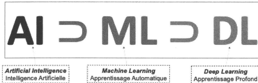
Figure 1 : l'apprentissage profond est un sous-domaine de l'apprentissage automatique, qui lui-même est un sous-domaine de l'intelligence artificielle.

cascade sur plusieurs couches (d'où leur qualificatif de réseaux profonds ). La Figure 1 ci-dessous résume la relation entre l'intelligence artificielle, l'apprentissage automatique et l'apprentissage profond.