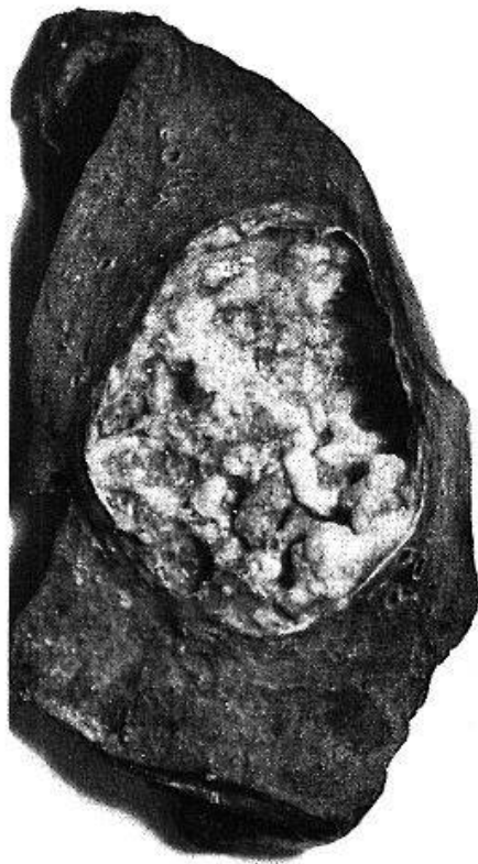
Abb. 3. Operationspräparat.

war außerdem ein Pneumothorax entstanden, der sich aber glücklicherweise nicht infiziert hat. In diesem Zustand kam der Kranke in unsere Behandlung (Abb. 2). Er hatte bis 200 ccm eitrigem Auswurf täglich. Er wurde Tag und Nacht durch fast unstillbaren Husten gequält, so daß er trotz allen Mitteln kaum mehr schlafen konnte. Da das Herz elektrokardiographisch geschädigt war, entschlossen wir uns erst nach einigem Zögern zur Operation. Der Eingriff wurde wider Erwarten gut überstanden. Husten und Auswurf hörten nach einigen Tagen ganz auf. Der Kranke erholte sich sehr rasch, nahm 9 kg an Gewicht zu und konnte 8 Wochen nach der Operation bei gutem Befinden praktisch beschwerdefrei entlassen werden. Er wurde angewiesen, den Druck im Pneumothorax überwachen zu lassen.