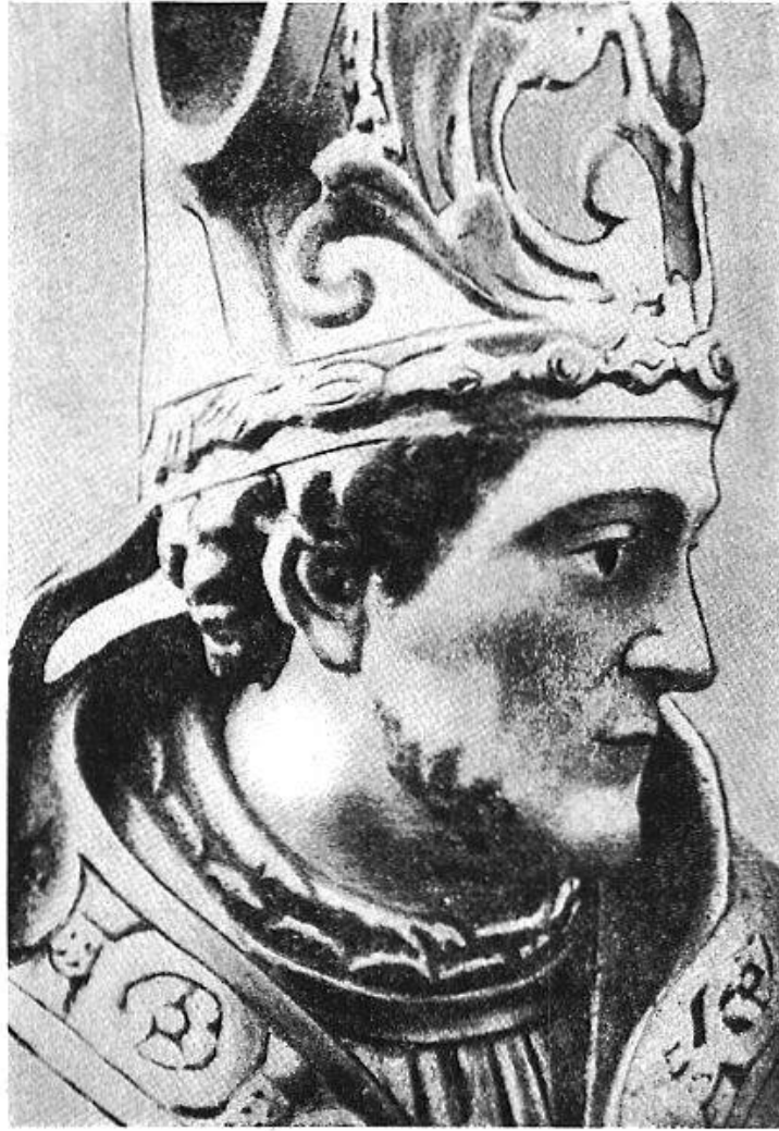
Abb. 5. Büste eines Bischofs mit Halsdrüsenanschwellung. 17.–18. Jahrhundert. Aus Iconographie de la Salpêtrière IV. pl. XVII, p. 381. Nach Cabanes: Esculape chez les artistes . Librairie Le François, Paris 1928.

Alle Schichten der Gesellschaft waren betroffen. Abb. 5 zeigt die Büste eines an durchbrechenden Halsdrüsen erkrankten Bischofs.