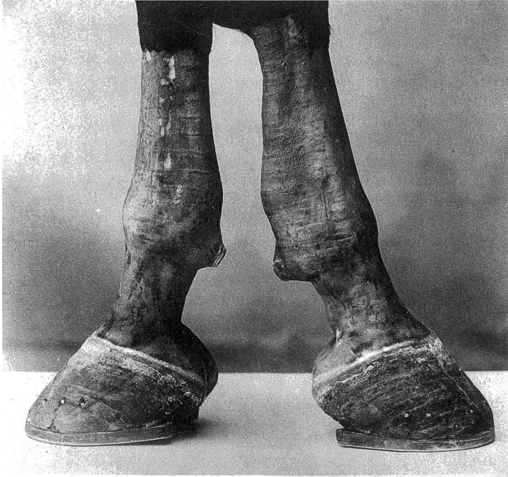
Fig. 2. Vordergliedmassen mit beidseitiger Verdickung der untern Sehnenscheide der Beuger. Wadenförmige, volare Vorwölbung besonders rechts. Anfüllung der Sehnenscheidenpartie in der Fesselbeuge rechts. Die rasierte Haut zeigt Strichfeuernarben.