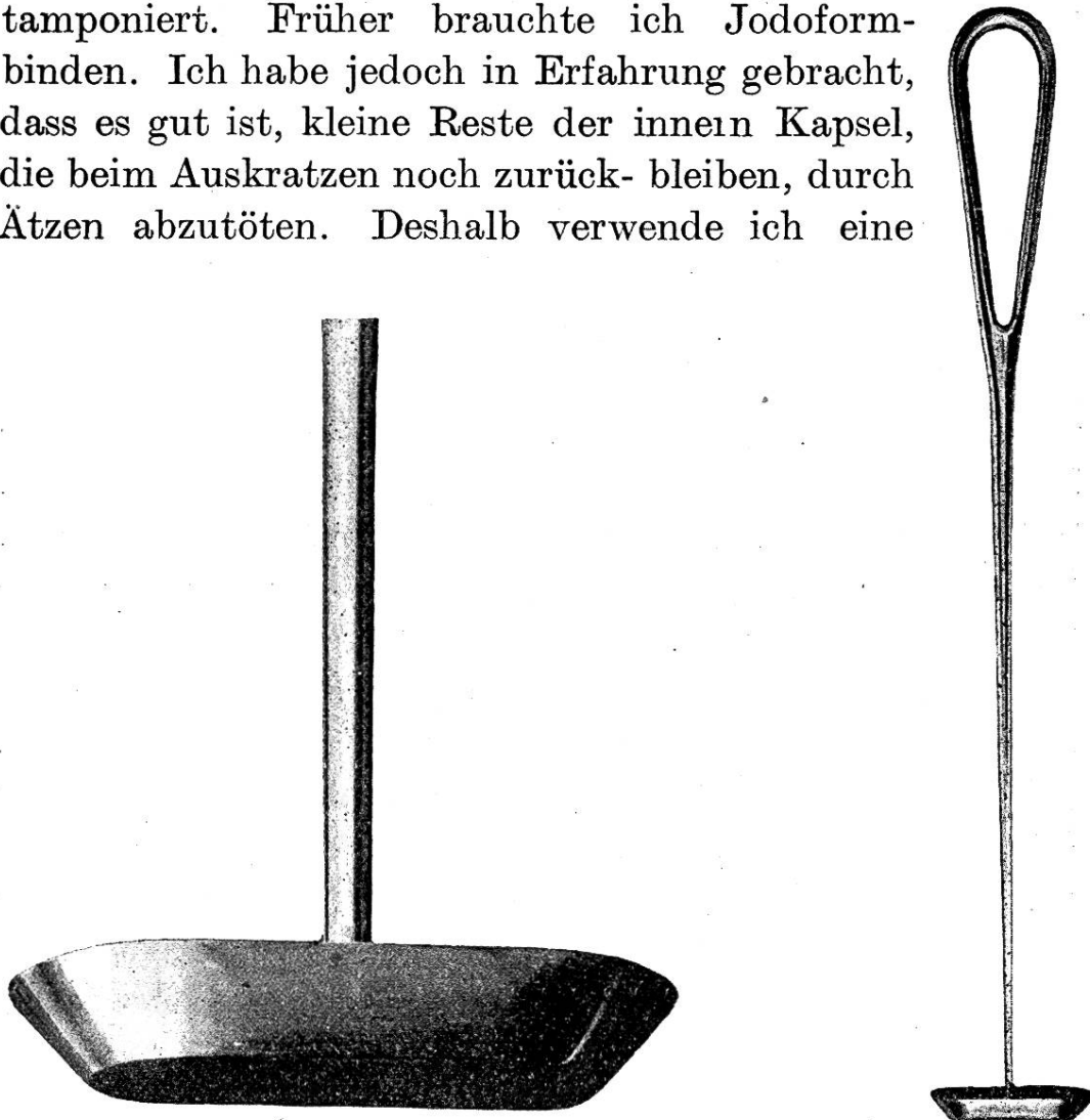
Fig. 3. Curette von Wilhelm Ziegler, Bern.

Die ganze Höhle wird nun mit einer Gazebinde austamponiert. Früher brauchte ich Jodoformbinden. Ich habe jedoch in Erfahrung gebracht, dass es gut ist, kleine Reste der innern Kapsel, die beim Auskratzen noch zurückbleiben, durch Ätzen abzutöten. Deshalb verwende ich eine