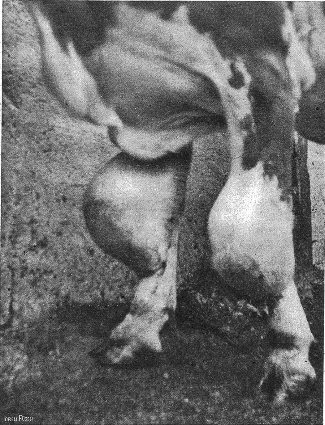
Fig. 2. Kniebeule des Rindes.

Die Behandlung der Kniebeule war für mich bis vor einigen Jahren eine recht undankbare Sache. Viele Misserfolge und recht wenig Heilungen. Nach dem