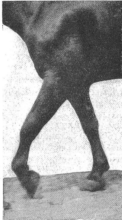
Fig. 1. Totale, linksseitige Radialislähmung beim Pferd.

Bei unvollständiger Lähmung wird das Einbrechen in den Gelenken nur zeitweilig, namentlich auf unebenem Boden beobachtet. Ist die Tricepsgruppe partiell funktionsunfähig, wie man das primär oder im Heilungsstadium totaler Lähmungen sehen kann, so wird ruckweises Vorschieben des Schultergelenkes