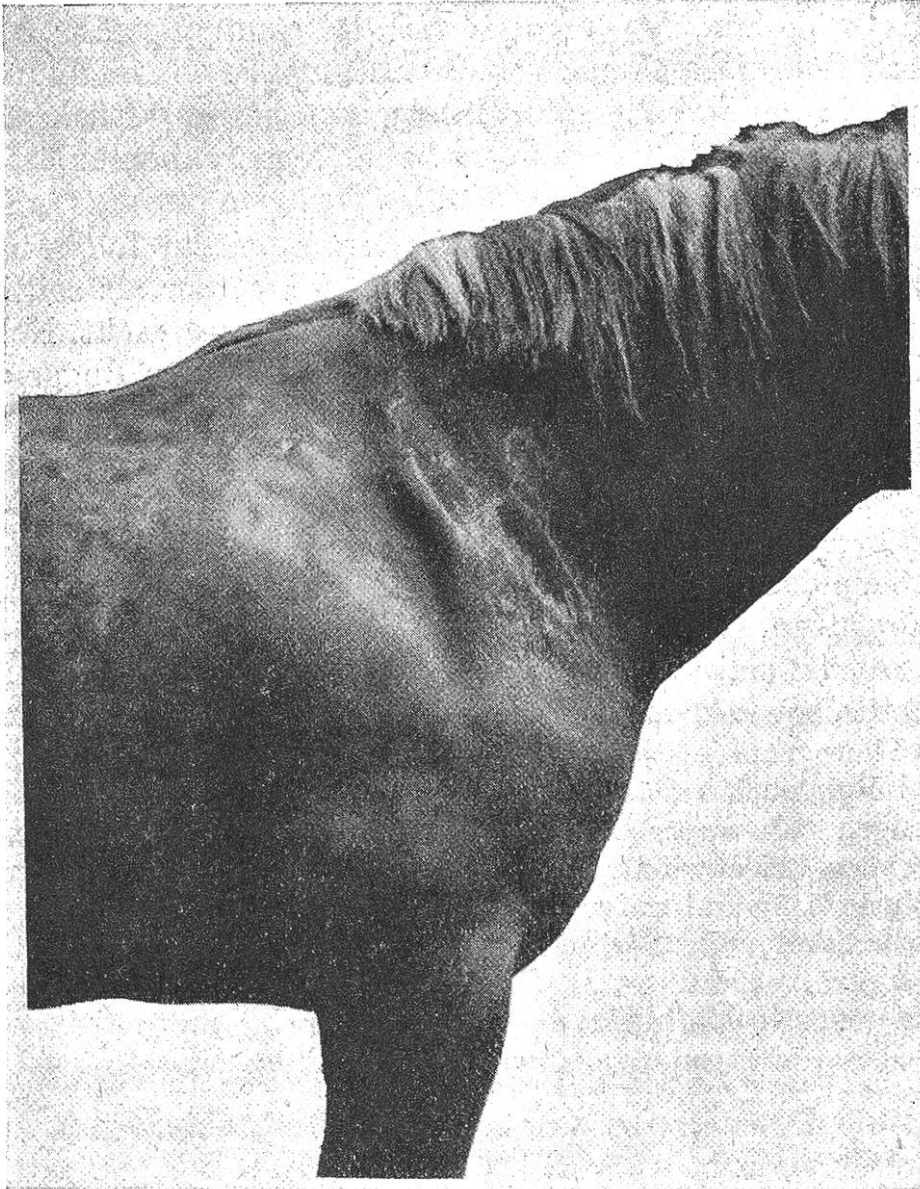
Fig. 2. Pferd mit Muskelatrophie im Innervationsgebiete des rechten Nervus suprascapularis nach Quetschung desselben.

Demgegenüber glaubt Schimmel auf Grund seiner Erfahrungen, dass jede Suprascapularislähmung heilen könne.