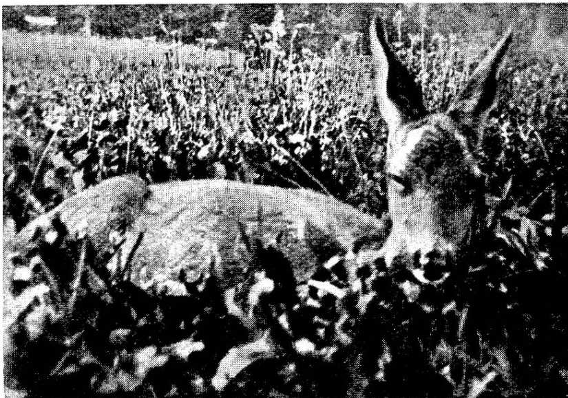
Bild 2. Schmalreh in seinem Krankenlager.