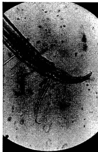
Abb. 4. Tibia-Ende und Tarsus mit Kralle und charakteristischem „Haar“ des 2. und 3. Beinpaares.

Ferris äußert auch den einleuchtenden Gedanken, daß der Rüssel der Elefantenlaus viel eher mit dem der Rüsselkäfer verglichen werden könnte als mit dem Instrument der Läuse. Markant sind auch die 5gliedrigen Antennen. Die Zahl der Glieder wäre wieder charakteristisch für Läuse.