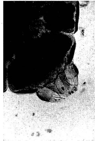
Abb. 6. Abdomenende Imago ♀.

Wenn die Genitalöffnung des Weibchens als zwischen dem 8. und 9. Segment gelegen betrachtet wird, so wären auf Grund der sichtbaren Abschnitte das 1. und 2. Segment und das 9. und 10. Segment verschmolzen. Die Stigmen sind nach dieser Betrachtungsweise im 3. bis 8. Segment auf der Dorsalseite zu finden. Die Dorsalseite des Abdomens ist mit deutlichen Tergiten auf dem 2. bis 8. Segment ausgezeichnet; die Ventralseite trägt auf dem 2. bis 8. Segment eine charakteristische Beborstung. Während die Borsten der Ventralseite der Imagines spatelförmig sind, beobachtete Ferris, daß die Dornen der Jugendformen stilettförmig gebaut und nicht in so regelmäßigen Reihen angeordnet sind. An diesen Merkmalen und an der Naht der charakteristischen Mittelplatten der Tergite sollen die Jugendstadien erkannt werden können.