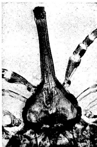
Abb. 3. Kopf des Imago.

Vor allem ist die Tatsache zu bemerken, daß von einem Stechapparat, wie ihn die eigentlichen Läuse besitzen, bisher nichts nachgewiesen werden konnte.