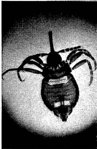
Abb. 1. Haematomyzus elephantis. Imago ♂.

Die Bilder 1 und 2 zeigen die Imaginalformen männlich und weiblich.