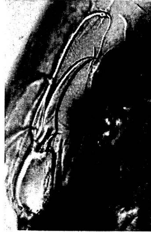
Abb. 8. Detail-Bild aus unterstem Ei von Abb. 7. Läßt Extremitätenende des 2. oder 3. Beinpaares erkennen.

Die systematische Einordnung von Haematomyzus elephantis bietet Schwierigkeiten. Piaget sieht von einer Festlegung ab. Spätere Bearbeiter rechnen die Form ausnahmslos zu den Läusen. Auch die neueste und unseres Erachtens gute Bearbeitung der Systematik der Läuse durch George Nuttall ( Parasitology 11. 329, 1918/19), der die Ordnung der Anoplura in die beiden Unterordnungen Mallophaga und Siphunculata einteilt, zählt 4 Familien der Siphunculata auf, worunter die Familie der Haematomyzidae figuriert.