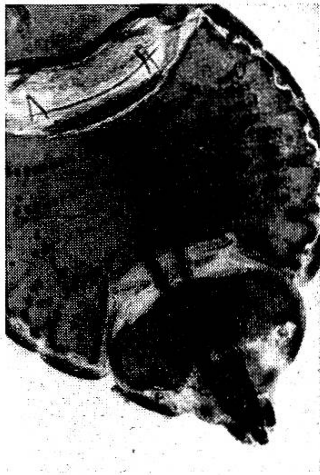
Abb. 5. Abdomenende Imago ♂.

Das Abdomen ist bei den geschlechtsreifen Tieren durch die typische Gestaltung des Abdomenendes ausgezeichnet. Abb. 5 und 6 zeigen den Dimorphismus der Geschlechter.