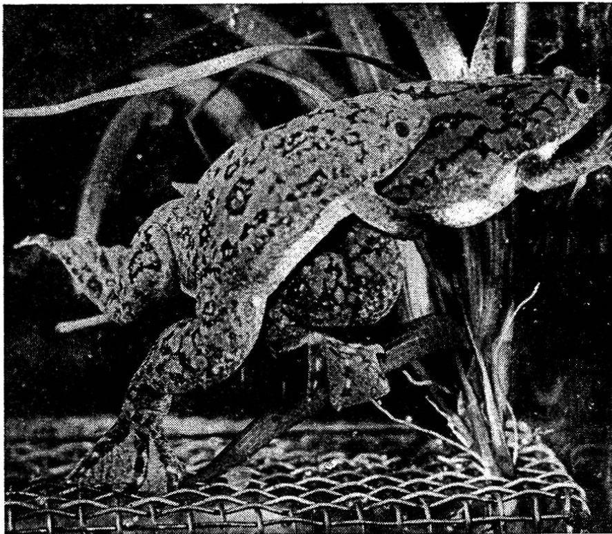
Abb. 1. Krallenfrosch-Männchen und Weibchen.

In neuerer Zeit findet der von Shapiro und Zwarenstein 1933 erstmals beschriebene, aber erst in den letzten Jahren allgemein bekannt gewordene Test vermitteltst des afrikanischen Krallenfrosches vermehrte Anwendung. Der Krallenfrosch ( Xenopus laevis ) wird zoologisch den zungenlosen Froschlurchen zugeteilt. Brehm gibt an, daß er im tropischen Afrika und in Südafrika zu Hause sein soll. In geschlechtsreifem Zustande sind die Tiere 5—10 cm lang und wiegen 35—100 g. Sie sind schwarzbraun gefärbt und zeigen in ihrer Rückenpartie schwarzbraune bis olivengrüne Flecken.