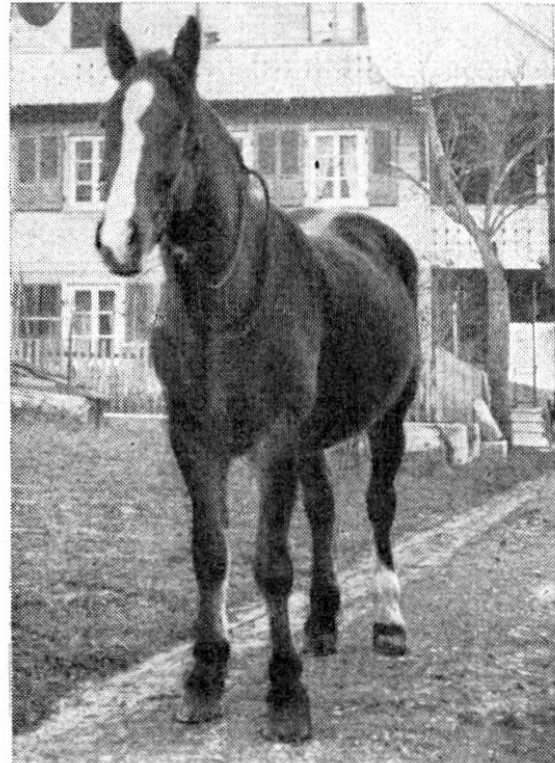
Abb. 2. Gleiches Fohlen, 1 Jahr später.

Krüppeln können keine Spitzentiere gemacht werden. Wo innere oder äußere Umstände (Vererbung, Mangelkrankheiten, fehlerhafte oder rechthaberische Tierhaltung und Pflege) dem Jungtier ihren Stempel allzusehr aufgedrückt haben, da werden vorhandene Fehler und Mängel nie mehr ganz verschwinden. Ein voller Erfolg, über ein gewisses Maß hinaus, wird hier also, auch bei großem Fleiß, nicht erwartet werden dürfen.