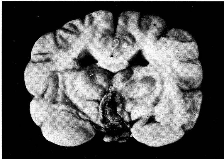
Abb. 2. Frontalschnitt durch das Gehirn, von hinten nach vorn betrachtet, auf der Höhe der größten Ausdehnung des intrazerebralen Tumorteiles. Zusammendrängung des dritten Ventrikels und Erweiterung der Seitenventrikel.

nuß, ist unregelmäßig mehrhöckerig, gelb und rötlich gefärbt und von einer dünnen, gefäßreichen Kapsel umspannt. In ihrer dorso-nasalen Partie, am Übergang in das nicht mehr identifizierbare Infundibulum, ist sie schwärzlich-hämorrhagisch und sehr brüchig (Abbildung 1). Am herausgenommenen Gehirn befindet sich an der Stelle der Zwischenhirnbasis gleiches, hämorrhagisches Tumormaterial, und ein Frontalschnitt auf dieser Höhe zeigt, daß sich die Neubildung keilförmig bis hoch in den 3. Ventrikel hinauf erstreckt, dabei die Region des medialen Hypothalamus und der ventromedialen Thalamusgebiete einnehmend. Die Seitenventrikel sind in ihrer ganzen Ausdehnung mäßig erweitert, Sehnerven, Chiasma und Tractus optici scheinen unversehrt (Abbildung 2).