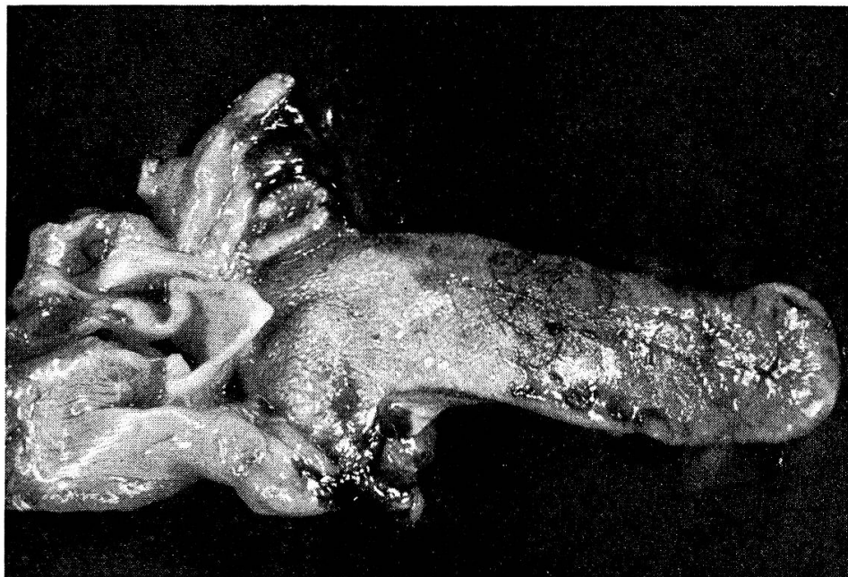
Abb. 1. Makroaufnahme von Fall 2. Tonsillenkrebs links mit Bildung eines seichten Ulcus mit wallartigen Rändern.

somit mit Cotchin feststellen, daß gelegentlich auch in makroskopisch wenig verdächtigen Tonsillen krebssige Wucherungen vorhanden sein können. In 2 Fällen konnte allerdings nur die makroskopisch deutlich veränderte Mandel histologisch untersucht werden.