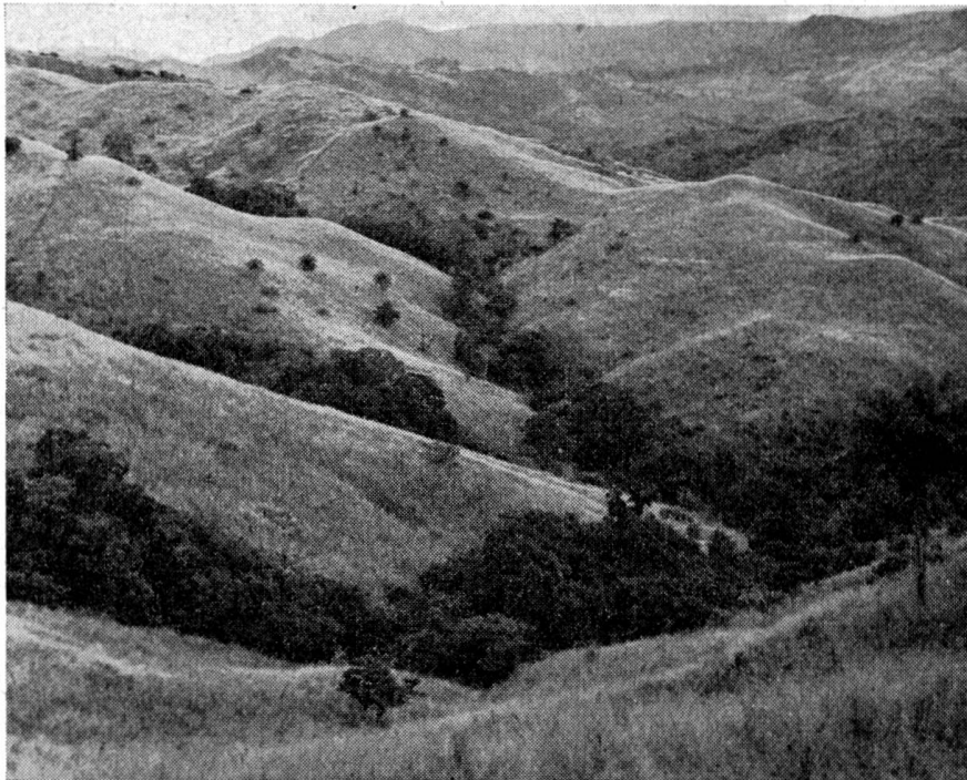
Blick in die unserem Schlachtvieh zur Verfügung stehenden Bergweiden.