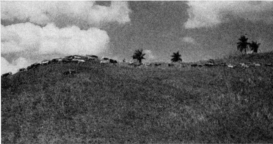
Wochenlang dauerndes mühsames Zusammentreiben der Rinder in schwierigem Gelände, das an Pferd und Reiter größte Anforderungen stellt.