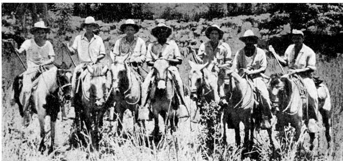
Unsere «Sabaneros»: ein im Sattel lebender harter, unerschrockener Menschenschlag.