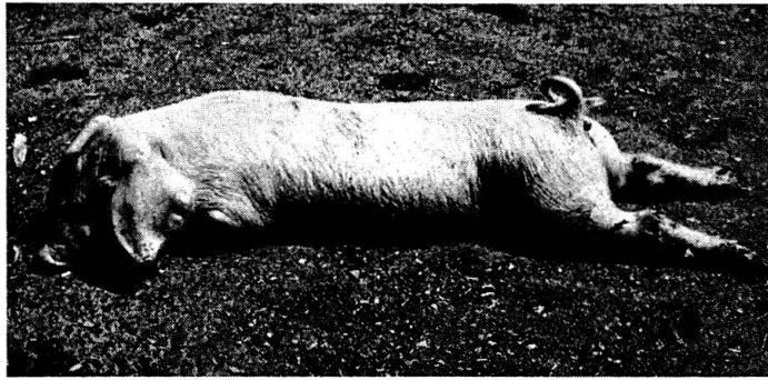
Abb. 1 5wöchiges Ferkel mit hochgradigen Lähmungserscheinungen an den Gliedmaßen.

zwei Tagen abgesehen – während der ganzen Dauer der Krankheit einen munteren Eindruck. Auch die hochgradig gelähmten Ferkel blieben mit einer einzigen Ausnahme in der Gewichtsentwicklung nicht oder nur unbedeutend zurück. Dieser Zustand dauerte 3 bis 10 Tage und begann sich dann allmählich zu bessern. Die Lähmungserscheinungen verschwanden zunächst an den Vordergliedmaßen und etwas später auch in der Nachhand. Nach durchschnittlich 12 Tagen waren die Gehstörungen auch bei diesen Schweinchen weitgehend verschwunden. Ein einziges Ferkel, das in der Entwicklung stark zurückgeblieben war, starb im Alter von 5 Wochen. Fünf Tiere, die während 10 Tagen weitgehend paralytisch waren, erholten sich allerdings nur sehr langsam und zeigten noch 10 Wochen später einen unsicheren, schwankenden Gang. Überdies entwickelte sich bei ihnen bis zu diesem Zeitpunkt eine ausgeprägte Ellbogen- und Karpalbeugehaltung (Abb. 3 und 4), die aber im Schlachalter nur noch undeutlich zu erkennen war.