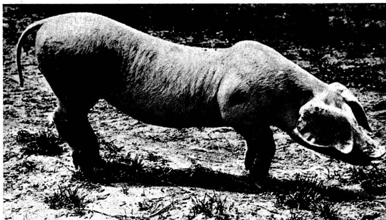
Abb. 4 3½ Monate altes Läuferschwein mit charakteristischen Spätsymptomen der Benignen Enzootischen Parese: Deutliche Ellbogen- und Karpalbeugehaltung, steile Stellung in den Fesselgelenken, Einsacken des Rückens und Bildung eines Hängebauches.

Es handelte sich um vaskuläre und perivaskuläre Infiltrate mit lymphoiden Elementen und vereinzelt Plasmazellen. Außerdem fanden sich auch im Parenchym stellenweise lockere, gelegentlich auch kompaktere Herdchen, die sich teils aus den obgenannten Infiltratzellen und teils aus sogenannter Mikroglia zusammensetzten. Die Veränderungen waren über das ganze ZNS verteilt und vorwiegend, aber nicht ausschließlich in der grauen Substanz lokalisiert. Sie ließen sich sowohl in der Großhirnrinde als auch im Hirnstamm