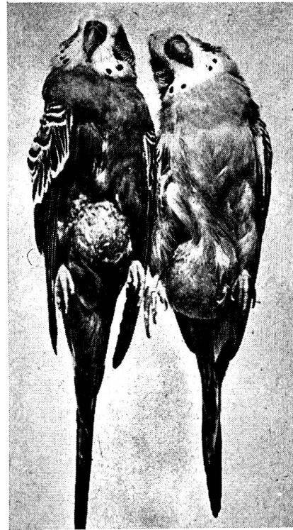
Abb. 1 Kropfentzündung mit Erbrechen schleimigen Kropfinhaltes