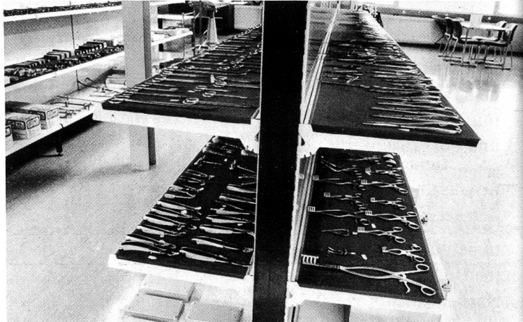
Hunderte von Instrumenten bester Qualität