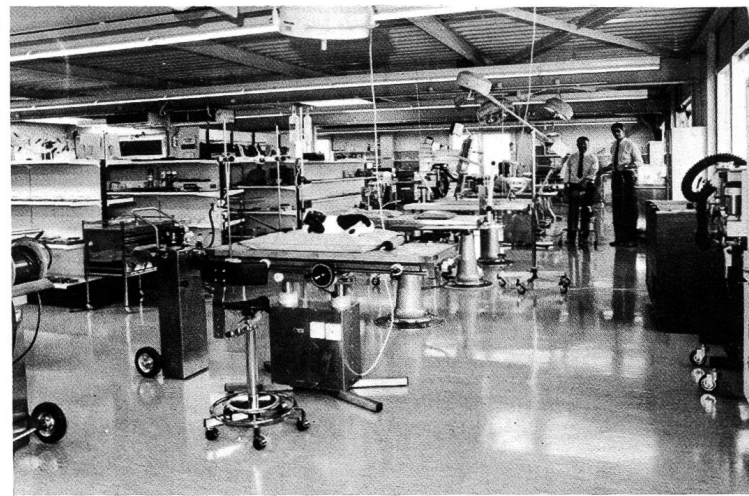
OP- und Untersuchungstische, OP-Lampen, Narkose-Apparate usw.

Unsere Ausstellung – Ihr Vorteil! Ein Besuch lohnt sich