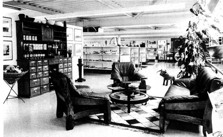
Eine alte Tierarzt-Apotheke am Eingang unserer Ausstellung

Hier einige Ausschnitte aus unserer umfassenden Ausstellung: