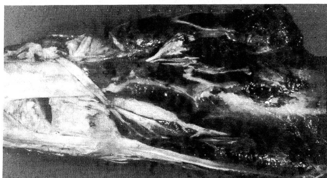
Abb. 3: Subakute, mit Fibrinexsudation und Hämorrhagien einhergehende Entzündung im Bereich des distalen Abschnittes des Musculus extensor carpi radialis, seiner Fascie und des Übergangs in seine Endsehne. DFV-Kuh, 3 J.

Pathomorphologische Befunde: Jeweils in den distalen muskulären Anteilen des M. extensor carpi radialis und manchmal, dann aber geringer ausgeprägt, des M. extensor digitorum communis sowie des M. abductor digiti I longus fällt eine ödematös-hämorrhagische Infiltration des Gewebes auf. Die Fascie des M. extensor carpi radialis ist schwartig verdickt. Die Endsehne dieses Muskels lässt klare Konturen vermissen. Ihre Sehnnenscheide ist ebenfalls verdickt und enthält hämorrhagisch-fibrinöses Exsudat (Abbildung 3), das durch sulzig-schwieeliges Granulationsgewebe in Organisation begriffen ist. Die Sehne und ihre Sehnnenscheide sind teilweise durch zottiges und Spalträume aufweisendes Granulationsgewebe miteinander verbunden (Abbildung 4).