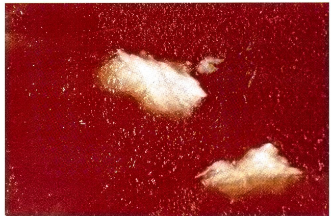
Abbildung 2: Stereomikroskopische Darstellung der weisslichen Einlagerungen

Solche Proben werden immer wieder eingesandt, und meist wird die Vermutung geäussert, dass es sich um parasitär bedingte Verkalkungen handelt. Daher scheint es zweckmässig, darauf einzugehen.