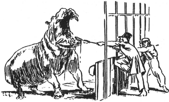
Abbildung 1: Zahnextraktion bei einem Nilpferd im Zoo London, 1860

zwischen seinem Teich und dem Eisengitter errichten. Ich entschloss mich den gebrochenen Zahn zu ziehen, was ich dann auch am vergangenen Mittwoch, nicht ohne furchtsames Ringen, durchgeführt habe. Ich hatte eine zwei Fuss lange Zange vorbereiten lassen. Damit packte ich den gebrochenen Schneidezahn, in der Hoffnung das schöne Stück Elfenbein mit einer festen und entschlossenen Drehbewegung in Besitz nehmen zu können. Dies war jedoch nicht so einfach. Überrascht durch meine Unverschämtheit wich die Bestie zurück und entriss mir die Zange. Gerade als ich die Zange wieder in der Hand hatte, griff mich das Tier an. Gar fürchterlich, wie dies Nilpferde können, schaute es mich an. In einem zweiten Versuch konnte ich den Zahn lange genug halten, bis er sich bewegte. Dennoch musste ich erneut aufgeben. Es war aber nicht nötig dem Tier zu befehlen, das Maul zu öffnen. Dies tat es nämlich im weitesten Ausmass. Ich hatte folglich keine Mühe, das begehrte Stück noch einmal zu fassen und vermochte es diesmal aus dem schauerhaften Kiefer zu ziehen. Bemerkenswert war, mit welcher Kraft das wütende Biest die Luft aus den Nasenlöchern stiess. Der Atem blies mir ins Gesicht, dass mir beinah' bange wurde....» Das Tier lebte nach dieser Operation noch manche Jahre ohne weitere Beschwerden (Vevers, 1976).