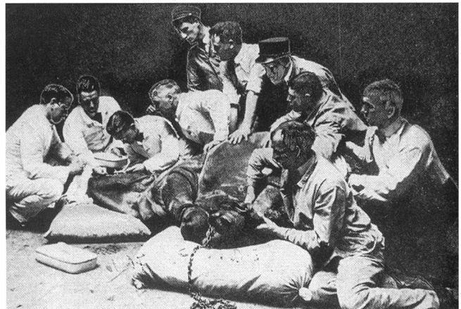
Abbildung 2: Augenoperation bei einem Panzernashorn im Zoo New York, um 1907.